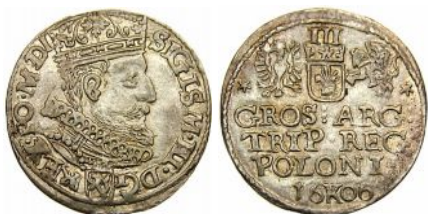
Siedmiogrodzkie naśladownictwo trojaka krakowskiego Zygmunta III Wazy z roku 1606 niska próba srebra i zaniżona waga