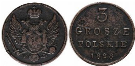
Trojak Królestwa Polskiego z roku 1828 na awersie pod orłem carskim inicjały FH Fryderyka Hungera