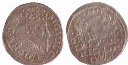
Trojak Zygmunta III Wazy z roku 1596 na awersie na końcu legendy otokowej niezidentyfikowany kwiat na rewersie u góry Orzeł, Pogoń i herb Snopek, u dołu herb Lewart oraz monogram IF Jana Firleja

Innym z kolei przykładem jest prezentowany poniżej trojak olkuski z roku 1596. W tym przypadku na końcu legendy otokowej awersu widzimy kwiat, który również nie sposób przyporządkować do znanych znaków mennicznych. Być może trojak ten powinien zostać umieszczony w rozdziale XIX tego opracowania traktującym o fałszerstwach.