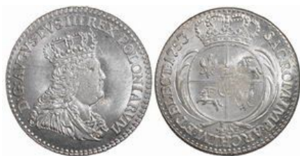
Trojak (½ szóstaka) Augusta III z roku 1753 bez znaków mennicznych na awersie i rewersie

Trojaki Augusta III pochodziły przede wszystkim z mennic pomorskich w Gdańsku, Toruniu i Elblągu (opis w rozdz. X-XII). Ponadto w latach 1753-1756 ten rodzaj monety bity był w mennicy w Lipsku 57 . Pod kątem oznaczeń mennicznych wyróżniamy dwa rodzaje trojaków lipskich, tj. trojaki bez jakichkolwiek oznaczeń mennicznych oraz trojaki sygnowane inicjałami EC Ernesta Dietricha Crolla, zarządcy mennicy w latach 1753-1763. Monogram Ernesta Crolla umieszczony był na rewersie pod ukoronowaną 5-polową tarczą z herbami Polski, Litwy i Wettinów.