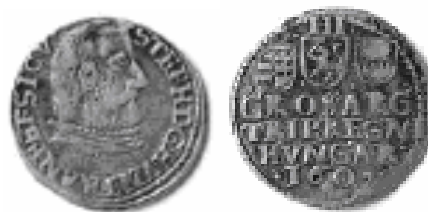
Naśladownictwo siedmiogrodzkie Stefana Bocskaja z roku 1607