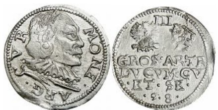
Trojak Wilhelma Kettlera z roku 1598 na rewersie herby Polski i Litwy