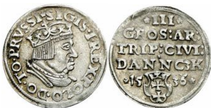
Trojak Zygmunta I Starego z roku 1536 na rewersie pod napisem strefowym herb miasta Gdańska