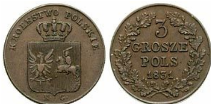
Trojak Królestwa Polskiego w czasie Powstania Listopadowego z roku 1831 na awersie pod ukoronowaną tarczą herbową z Orłem i Pogonią inicjały KG Karola Gronau