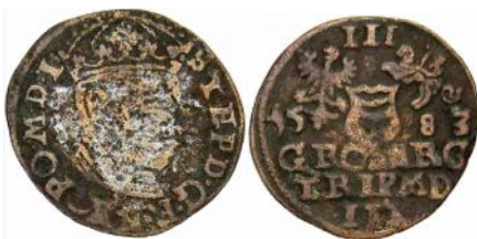
Falszerstwo z epoki trojaka litewskiego Stefana Batorego z roku 1583 moneta z miedzi posrebrzana