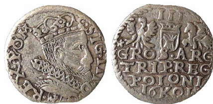
Naśladownictwo bałkańskie trojaka krakowskiego Zygmunta III Wazy z datą 1601 bity w dobrym srebrze