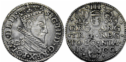
Nieokreślone naśladownictwo trojaka Zygmunta III Wazy z pomyłką datą 1900