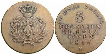
Trojak Wielkiego Księstwa Poznańskiego z roku 1816 na awersie herb Prus na rewersie pod napisem strefowym litera B (Wrocław)

Po 1831 roku ograniczono autonomię Księstwa Poznańskiego, a w roku 1848 zniesiono ją zupełnie.