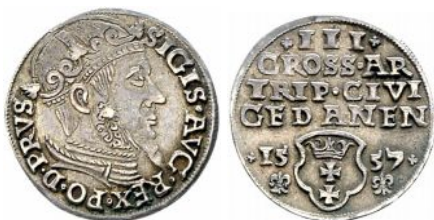
Trojak Zygmunta II Augusta z roku 1557 na rewersie pod napisem strefowym herb miasta Gdańska, po jego bokach lilie