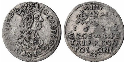
Trojak Jana Kazimierza z roku 1662 na rewersie u góry Orzeł, Pogoń i herb Snopek, rozdzielony liczbą III monogram AT Andrzeja Tymfa, u dołu pod napisem strefowym herb Ślepowron Jana Krasieńskiego

Za Jana Kazimierza w mennicy krakowskiej bito trojaki w latach 1661-1662 i 1665. Na trojakach tego króla obok Orła, Snopka – herbu Wazów i Pogoni występują inicjały AT Andrzeja Tymfa, wcześniejszego zarządcy mennicy koronnej w Poznaniu – zarządzającego między innymi mennicą w Krakowie, w latach 1661-1668. Ponadto widnieje na nich herb Ślepowron 15 podskarbiego wielkiego koronnego Jana Kazimierza Krasieńskiego (1659-1668). Trojaki tego wzoru z roku 1665 mogły być bite także w mennicy bydgoskiej, którą Tymf dzierżawił w latach 1663-1667.