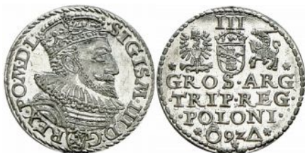
Trojak Zygmunta III Wazy z roku 1592 na awersie herb Lewart na rewersie u góry Orzeł, Pogoń i herb Snopek, u dołu znak pierścienia Kaspra Goebła oraz znak trójkąt Gracjana Gonzalo

W tym miejscu należy podkreślić, że emisje trojaków zyguntowskich z mennicy w Malborku – w porównaniu z bitymi w innych mennicach koronnych – charakteryzowały się wyjątkowo starannie wykonanymi do ich produkcji stemplami, co świadczy o wysokich umiejętnościach zatrudnionych tam rytowników stempli.