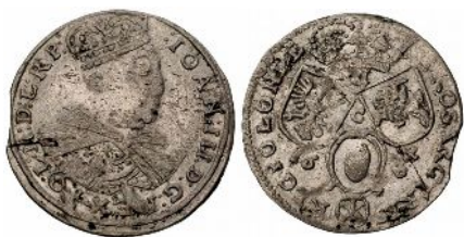
Trojak Jana III Sobieskiego z roku 1684 na rewersie między tarczami herbowymi Polski, Litwy i herbem Sobieskich Janina litera C (Cracovia), u dołu herb Jelita Marcina Zamoyskiego