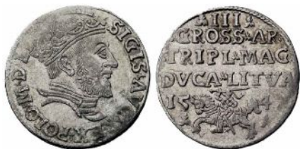
Trojak Zygmunta II Augusta z roku 1547 na rewersie herb Pogon oraz trójliście