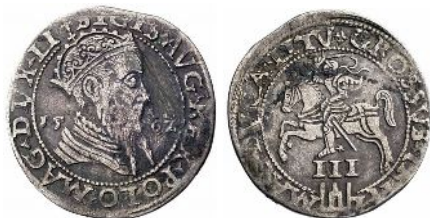
Trojak Zygmunta II Augusta z roku 1562 na rewersie herb Pogon i herb Kolumny na awersie i rewersie liście i trójliście