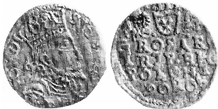
Nieokreślone naśladownictwo trojaka Zygmunta III Wazy z datą (15)96 ? bity w dobrym srebrze