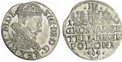
Trojak koronny Zygmunta III Wazy z roku 1620 na rewersie u góry Orzeł, Pogoń i herb Snopek, u dołu herb Sas Mikołaja Danilłowicza

Wykonanie postanowień uchwały sejmowej z 1598 roku wprowadzającej zakaz umieszczania na monetach innych znaków menniczych niż podskarbiowskie, w połączeniu z zamknięciem w roku 1601 niektórych mennic koronnych, tylko w małym stopniu może utrudnić przypisanie danego typu trojaka do określonej mennicy, ponieważ charakteryzują je także typowe dla danej mennicy wzory stosowanych stempli.