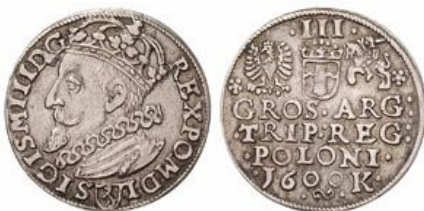
Trojak koronny Zygmunta III Wazy z roku 1600 na awersie herb Lewart Jana Firleja na rewersie u góry Orzeł, Pogoń i herb Snopek, u dołu po dacie litera K (Kraków)