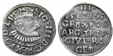
XIX wieczny fałszyfikat imitujący naśladownictwo trojaka ryskiego Zygmunta III Wazy z datą 1595