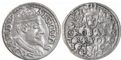
Trojak Zygmunta III Wazy z roku 1600 na rewersie u góry Orzeł, Pogoń i herb Snopek u dołu herb Lewart rozdzielający monogram IF Jana Firleja oraz literę I (Ilcusia)

Na zakończenie tego rozdziału wspomnieć należy, że niezliczona ilość wszystkich odmian trojaków polskich przejawia się także w tym, iż co pewien czas na rynku numizmatycznym pojawiają się nie notowane do tej pory w katalogach monet polskich kolejne ich odmiany. Takim przykładem może być prezentowany dalej trojak z mennicy olkuskiej z roku 1595, który pojawił się na aukcji portalu internetowego Allegro w marcu 2007 roku. Pod popiersiem królewskim widzimy tu ornament lub może poziomo ułożoną literę S. Jest to znak, który trudno dopasować do występujących w tym okresie znanych znaków mennicznych. Podobny ornament stosowany jako „ozdobnik” spotykamy na rewersie trojaków z mennicy krakowskiej bitych w latach 1600-1601.