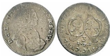
Trojak Jana Ernesta Birona z roku 1765 na rewersie herb Polski i Litwy oraz inicjały IFS Jana Fryderyka Schmickerta