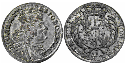
Falszywy trojak Augusta III z datą 1754 bity w jednej z mennic pruskich przez Fryderyka Wilhelma II