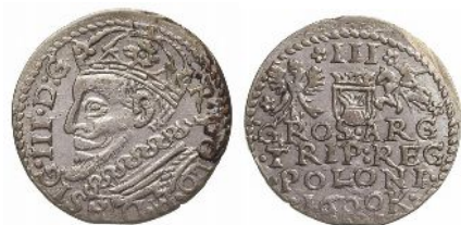
Falszerstwo z epoki trojaka krakowskiego Zygmunta III Wazy z roku 1600 niska próba srebra i zaniżona waga