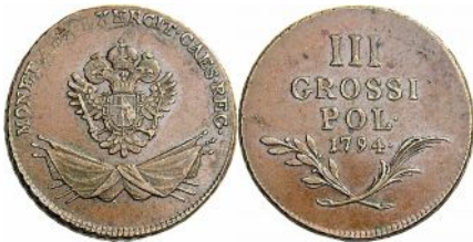
Trojak dla wojsk z roku 1794 na awersie herb Cesarstwa Rzymskiego Narodu Niemieckiego w otoczeniu sztandarów

Po wybuchu w 1794 roku powstania kościuszkowskiego Austria, bojąc się utraty ziem polskich zajętych na mocy pierwszego rozbioru, koncentruje tam swoje wojska i chcąc zjednać Polaków, nakazuje wybić według stopy polskiej specjalnie dla Galicji i Lodomerii miedziane grosze i trojaki, umieszczając na nich napis GROSSI POL(onicus). Monety te wybite zostały w mennicy wiedeńskiej i przeznaczone były do opłacenia żołdu wojskom austriackim skoncentrowanym na granicy z Polską. Na awersie „trojaka dla wojsk” umieszczony był herb Cesarstwa Rzymskiego Narodu Niemieckiego 66 nad sztandarami.