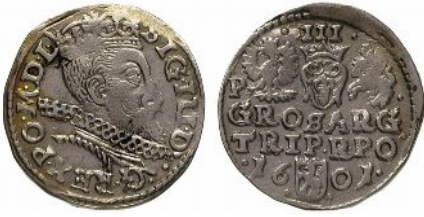
Trojaki Zygmunta III Wazy z roku 1601 na rewersie u góry Orzeł, Pogoń i herb Snopek, obok orła litera P (Poznań), u dołu herb Lewart Jana Firleja