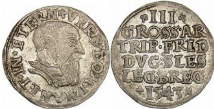
Trojak Fryderyka II z roku 1543 Księstwo Legnicko-Brzesko-Wołowskie na rewersie po bokach cyfry III i daty trójliście

Na trojakach cieszyńskich umieszczany był orzeł górnośląski 64 (w koronie, bez przepaski na piersiach). Ponadto na trojakach cieszyńskich umieszczany był znak Mikołaja Hevela de Colpino 65 , mincmistrza w latach 1591-1592, znak serce przebite hakiem mincmistrza Hansa Endresa (emisja z roku 1559) lub znak przypominający kształtem kokardę (w rzeczywistości pod dwoma złączonymi u podstawy trójkątami ligatura CR), znak Kaspra Rytkiera – emisje z roku 1596 i 1597.