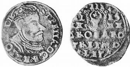
Naśladownictwo mołdawskie trojaka litewskiego Stefana Batorego z roku 15.....? na rewersie pod cyfrą III herb Mołdawii

W roku 1596 imitacje trojaków polskich bije także w szwedzkiej mennicy w Rewalu książę Zygmunt Waza (1594-1599). Na ich awersie przedstawione było popiersie królewskie i napis SIGIS.D.G.SVE.ET. POL.REX, a na rewersie strefowy napis III/15-herb-96/GROS.ARG./TRIP.REV/.ALLE.