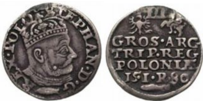
Trojak Stefana Batorego z roku 1580 na awersie pod popiersiem króla herb Glaubicz na rewersie u góry Orzeł i Pogoń, u dołu herb Glaubicz oraz inicjały IR Jakuba Rokossowskiego