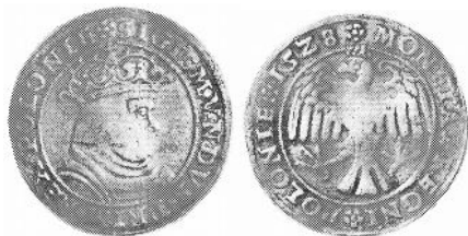
Trojak koronny Zygmunta I Starego z roku 1528 na awersie i rewersie niezidentyfikowany kwiat (rozeta ?)

W roku 1528 Zygmunt I Stary wybił w mennicy krakowskiej pierwsze polskie trojaki. Swoim wzorem (a także wagą tj. ok. 6,82-4,58g i średnicą ok. 28mm) odbiegały one od późniejszych emisji, co obrazuje niżej zamieszczona ilustracja. Za jedyne znaki mennicze występujące na tej monecie można uznać powtórzony na awersie i rewersie kwiat (może rozeta?). O tym, iż mógł być to znak menniczny świadczy zarówno miejsce jego umieszczenia, jak i fakt, że dokładnie ten sam znak spotykamy na innych monetach Zygmunta I (np. dukatach). Niestety źródła historyczne nic na ten temat nie wspominają.