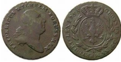
Trojak Prus południowych z roku 1796 na rewersie pod ukoronowaną tarczą z herbem Prus litera B (Wrocław)

Po upadku Napoleona, zgodnie z decyzją Kongresu Wiedeńskiego z 1815 roku, z części ziem Księstwa Warszawskiego utworzono Wielkie Księstwo Poznańskie stanowiące integralną część Prus.