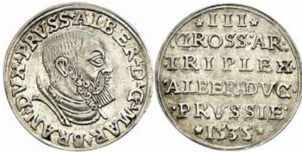
Trojak Albrechta Hohenzollerna z roku 1535 na awersie i rewersie brak znaków menniczych