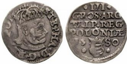
Trojak Stefana Batorego z roku 1580 na rewersie herb Trzy Zęby (brak herbów Polski i Litwy)

Na ostatnich trojakach z mennicy w Olkuszu (1600-1601) obok herbu Lewart widnieją inicjały IF Jana Firleja oraz litera I (Ilcusia).