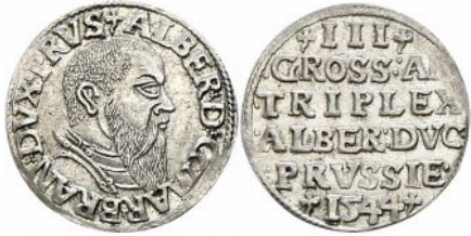
Trojak Albrechta Hohenzollerna z roku 1544 na rewersie u góry i u dołu napisu strefowego znaki mennicze w kształcie trójlistnej koniczyny