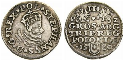
Trojak Stefana Batorego z roku 1580 na rewersie obok Orła i Pogoni inicjały PZ Piotra Zborowskiego oraz pod napisem strefowym herb Jastrzębic