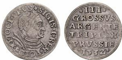
Trojak Zygmunta I Starego z roku 1532 bez oznaczeń mennicznych na awersie i rewersie

W działającej także od czasów Kazimierza Jagiellończyka – obok mennicy miejskiej w Gdańsku i mennicy miejskiej w Elblągu – miejskiej mennicy w Toruniu, zarządzanej od roku 1529 przez sekretarza królewskiego Josta Deciusza, bite były pierwsze trojaki Zygmunta Starego dla lennych ziem pruskich (emisja z lat 1528-1532 i 1534-1535). Wyróżniającą je cechą charakterystyczną był brak jakichkolwiek herbów i znaków mennicznych, zarówno na awersie, jak i na rewersie tych monet. Ten właśnie typ trojaka stał się pierwowzorem dla wszystkich kolejnych emisji tej monety, aż do II połowy XVII wieku.