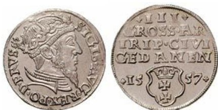
Trojak Zygmunta II Augusta z roku 1557 na awersie na końcu napisu otokowego lilia na rewersie pod napisem strefowym herb miasta Gdańska

Na trojakach Zygmunta II Augusta obok herbu gdańskiego występuje znak menniczy lilia – umieszczany na awersie lub na rewersie po bokach tarczy herbowej – nieznanego dzisiaj gdańskiego mincerza.