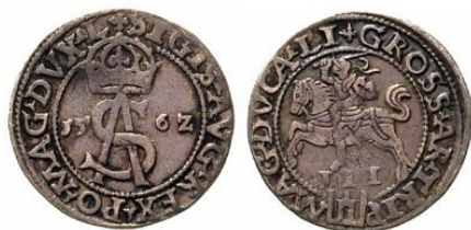
Trojak Zygmunta II Augusta z roku 1562 na awersie pod koroną monogram królewski SA, na rewersie herb Pogon i herb Kolumny na awersie i rewersie liście i trójliście