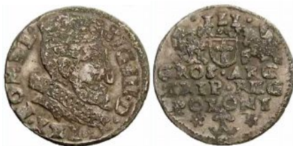
Nieokreślone naśladownictwo lub falszerstwo trojaka Zygmunta III Wazy (brak daty) niska próba srebra i zaniżona waga