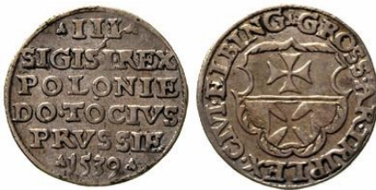
Trojak Zygmunta I Starego z roku 1539 na awersie po bokach nominatu III i daty oraz na rewersie nad herbem Elbląga znaki „trójliść”

Mimo, iż w niniejszym opracowaniu przeznaczono osobny rozdział obejmujący tematykę naśladownictwa trojaków polskich, jeden rodzaj takiego trojaka należy jednak opisać właśnie w tym rozdziale.