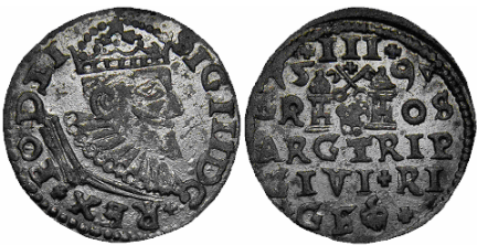
Falszerstwo z epoki trojaka ryskiego Zygmunta III Wazy z datą 1594 (babka ragusańska ?) bity ze słabego srebra