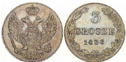
Trojak Królestwa Polskiego z roku 1836 na awersie pod orłem carskim monogram MW (mennica warszawska)