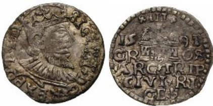
Naśladownictwo transylwańskie trojaka ryskiego Zygmunta III Wazy z roku 1591