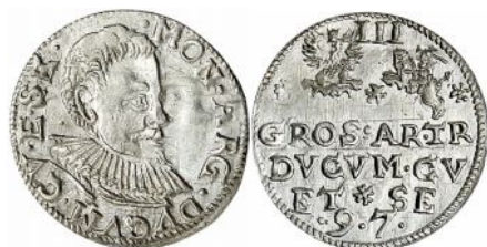
Trojak Fryderyka Kettlera z roku 1597 na rewersie Orzeł polski i litewska Pogoń oraz znaki mennicze (?) czterolistne kwiaty