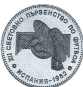
Световно първенство по футбол 1982 World football championship Spain 82 Сомbrero/Sombrero

1982 10 лв 18.75 g Ag 640 Ø 37.2 Тираж/mintage: 7 800 Гурт/edge: наръбен/serrated 192. мат-гланц/proof 15.-