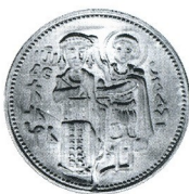
Иван Асен II. Ivan Assen II.

1981 50 лв 20.5 g Ag 900 Ø 36 Тираж/mintage: 9 997 Гурт/edge: гладък/flat