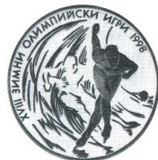
XVIII зимни олимп. игри Нагано 1998 18th Winter Olympic Games Nagano 1998