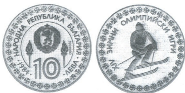
XIV. зимни олимпийски игри Сарајево 84 14th Winter Olympic Games Sarajevo 84