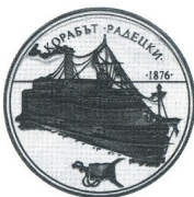
Корабът "Радецки" "Radetzki" ship