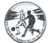
Световно първенство по футбол 1998 World football championship 1998