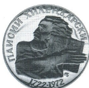
Паисий Хилендарски 1722-1972 Paisii Hilendarski 1722-1972

1972 5 лв 20.5 g Ag 900 Ø 36 Тираж/mintage: 199 998 Гурт/edge: вдлъбнати петолъчки/concave pentacles