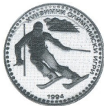
Зимни олимпийски игри 1994 - слалом Winter Olympics 1994 - slalom