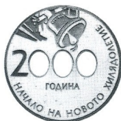
Ново хилядолетие New millenium

2000 10 лв 10 g Ag 925 Ø 34 Тираж/mintage: 6 000 Гурт/edge: гладък/flat