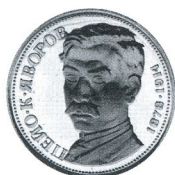
Пейо К. Яворов 1878-1914 Peyo K. Yavorov 1878-1914

1978 5 лв 20.5 g Ag 500 Ø 36 Тираж/mintage: 199 897 Гурт/edge: гладък/flat