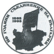
110 години от Съединението 110th Anniversary of Unification