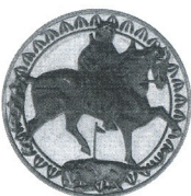
Мадарският конник Madara Horseman

1981 50 лв 20.5 g Ag 900 Ø 36 Тираж/mintage: 9 997 Гурт/edge: гладък/flat