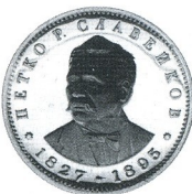
Петко Р. Славейков 1827-1895 Petko R. Slaveykov 1827-1895

1977 5 лв 20.5 g Ag 500 Ø 36 Тираж/mintage: 199 848 Гурт/edge: гладък/flat