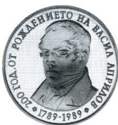
200 г. от рождението на Васил Априлов 200th Anniversary of birth of Vassil Aprilov