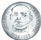
Добри Чинтулов 1822-1886 Dobri Chintulov 1822-1886

1972 2 лв 11 g Cu-Ni Ø 30 Тираж/mintage: 99 836 Гурт/edge: назъбен/serrated