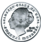
Людмила Живкова 1942-1982 Ljudmila Zhivkova 1942-1982

1982 5 лв 16.4 g Cu-Ni Ø 34.2 Тираж/mintage: 19 997 Гурт/edge: наръбен/serrated 189. мат-гланц/proof 3.-