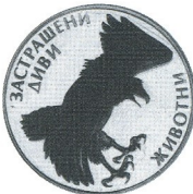
Застрашени диви животни - орел Endangered wild animals - eagle