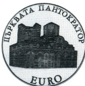
Църквата "Пантократор", Несебър The Church of Pantokrator, Nessebar

2000 10 лв 23.33 g Ag 925 Ø 38.61 Тираж/mintage: 20 000 Гурт/edge: гладък/flat