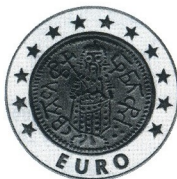
Монета на Тодор Светослав Тертер Coin of Todor Svetoslav Terter

2000 10 лв 23.33 g Ag 925 Ø 38.61 Тираж/mintage: 20 000 Гурт/edge: гладък/flat