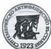
50 г. от Септемврийското въстание 50th Anniversary of September Uprising

1973 5 лв 20.5 g Ag 900 Ø 36 Тираж/mintage: 199 998 Гурт/edge: вдлъбнати петолъчки/concave pentacles