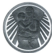
Майка с дете Mother and child

1981 50 лв 20.5 g Ag 900 Ø 36 Тираж/mintage: 9 996 Гурт/edge: гладък/flat