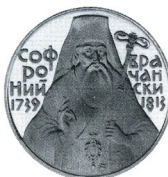
Софроний Врачански 1739-1813 Sofronii Vrachanski 1739-1813