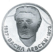
Васил Левски 1837-1973 Vassil Levski 1837-1973

1973 5 лв 20.5 g Ag 900 Ø 36 Тираж/mintage: 199 998 Гурт/edge: "СВЯТА И