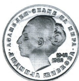
Людмила Живкова 1942-1982 Ljudmila Zhivkova 1942-1982

1982 20 лв 11.2 g Ag 500 Ø 30 Тираж/mintage: 9 999 Гурт/edge: гладък/flat 190. мат-гланц/proof 12.-