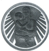
Майка с дете Mother and child

1981 25 лв 14 g Ag 500 Ø 32 Тираж/mintage: 99 911 Гурт/edge: гладък/flat