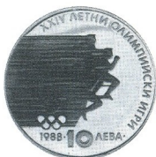
XXIV. летни олимпийски игри Сеул 88 24th Summer Olympic Games Seoul 88

1988 10 лв 18.75 g Ag 640 \varnothing 37.2