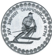
XIV зимни олимпийски игри Сараево 84 14th Winter Olympic Games Sarajevo 84

1984 10 лв 23.33 g Ag 925 Ø 38.61 Тираж/mintage: 8 464 Гурт/edge: "CITIUS ALTIUS FORTIUS" 193. мат-гланц/proof 60.-