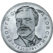
Георги Сава Раковски 1821-1867 Georgi Sava Rakovski 1821-1867

1971 5 лв 20.5 g Ag 900 Ø 36 Тираж/mintage: 299 997 Гурт/edge: вдлъбнати петолъчки/concave pentacles