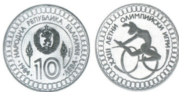
XXIII. летни олимпийски игри 1984 неотсечена монета 23rd Summer Olympic Games 1984 not minted coin

1984 10 лв 23.33 g Ag 640 Ø 38.61 Тираж/mintage: 50 Гурт/edge: гладък/flat мат-гланц/proof --