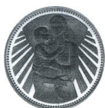
Майка с дете Mother and child

1981 1 000 лв 16.88889 g Au 900 Ø 30 Тираж/mintage: 2 000 Гурт/edge: гладък/flat