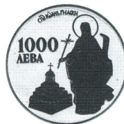
ЕСУ - Св. Иван Рилски ECU - St. Ivan Rilski