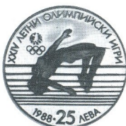
XXIV. летни олимпийски игри Сеул 88 24th Summer Olympic Games Seoul 88

1988 25 лв 23.33 g Ag 925 \varnothing 38.61