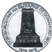
100 г. от Освобождението на България от турско робство 100th Anniversary of Liberation from Turks

1978 10 лв 30 g Ag 500 Ø 40 Тираж/mintage: 199 897 Гурт/edge: “ВЕЧНА СЛАВА НА БРАТЯТА ОСВОБОДИТЕЛИ”