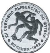
Световно първенство по футбол 1982 World football championship Spain 82 Футболисти/Football-players

1982 10 лв 18.75 g Ag 640 Ø 37.2 Тираж/mintage: 7 200 Гурт/edge: наръбен/serrated 191. мат-гланц/proof 15.-