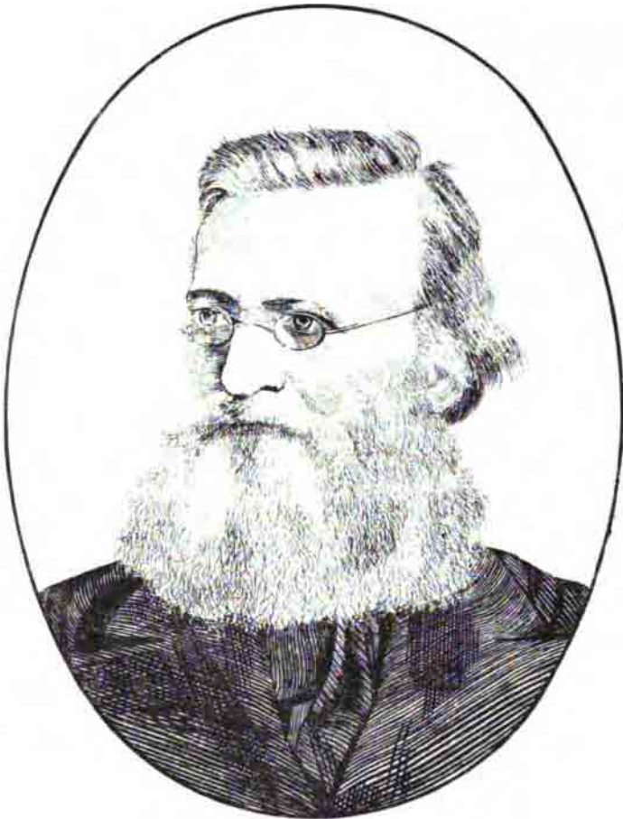
Николай Ивановичъ Костомаровъ