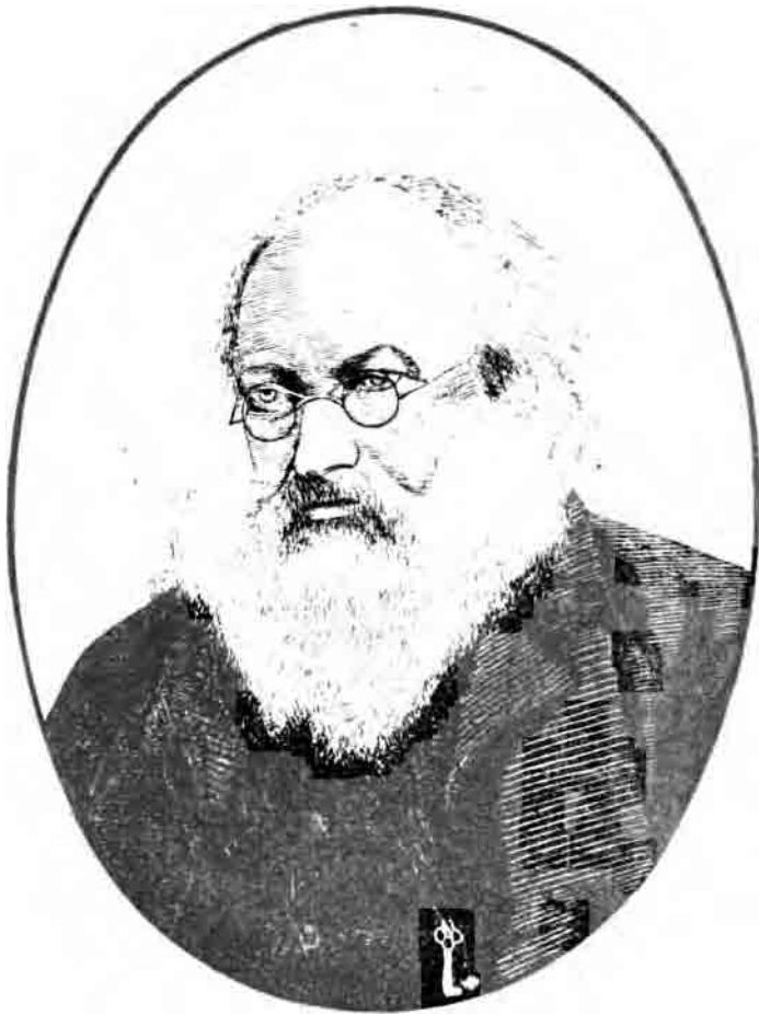
Николай Алексѣевичъ Сѣверцовъ