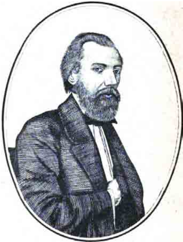
Иванъ Саввичъ Никитинъ.