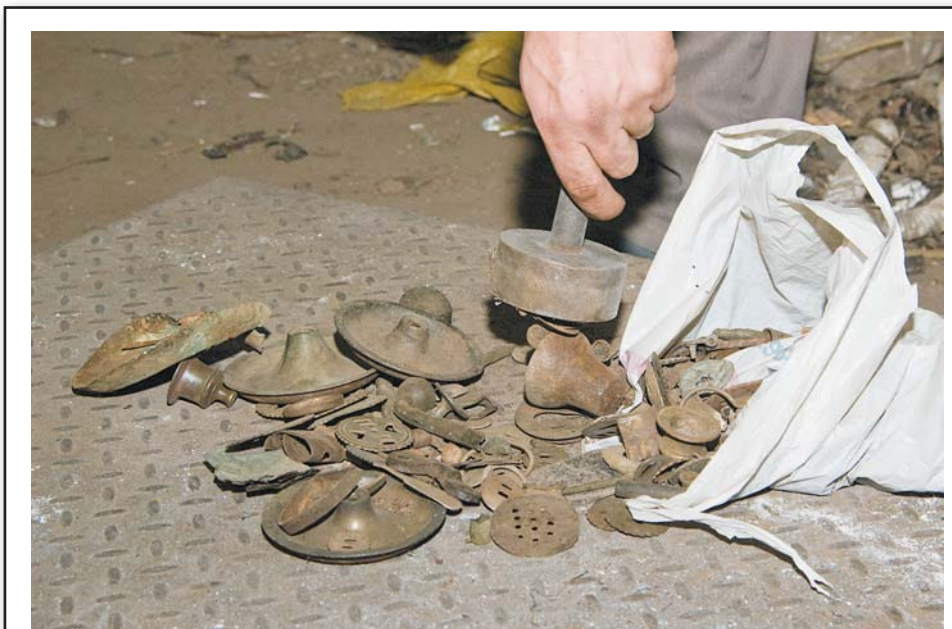
Отбраковка электромагнитом. Железяка не пройдет