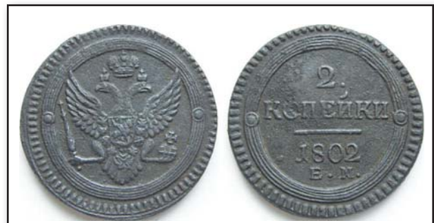
2 копейки Кольцевик, 1802, ЕМ, медь, XF, 5075.00