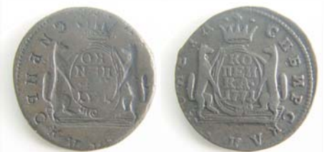
Сибирская копейка-«джокер» 1771 года. Продана на аукционе VIP-85 за 9234 рубля