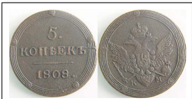
5 копеек Кольцевик, 1808, КМ, медь, XF, 11095.00