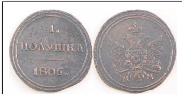
Полушка Кольцевик, 1805, КМ, медь, XF, 15500.00