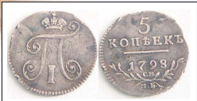
5 копеек, 1798, СМ МБ, серебро, XF, 19664.00