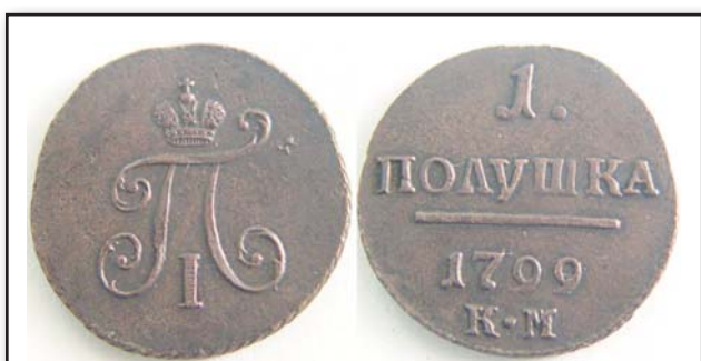
Полушка, 1799, КМ, медь, XF, 10226.00