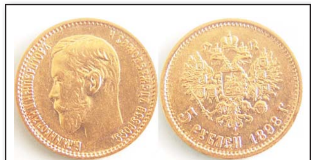
5 рублей, 1898, АГ, золото, XF, 6831.00