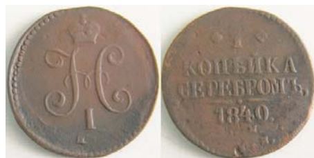
1 копейка 1840 года, двойной удар

Нарушение соосности происходит в тех случаях, когда штемпель оказывается плохо закрепленным на шпильках или шпильки ломаются. Штемпель при этом смещается относительно другого штемпеля. Изображения на разных сторонах