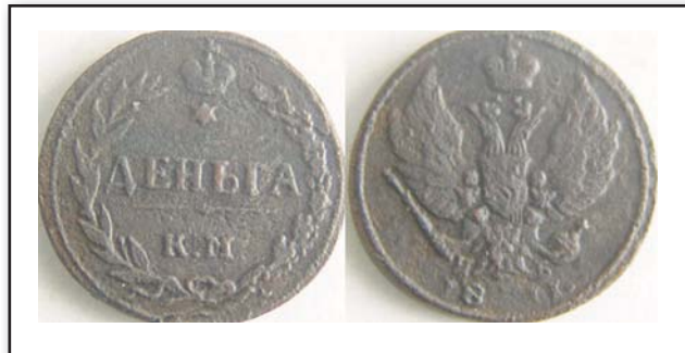
Денга, 1811, КМ ПБ, медь, VF, 7242.00