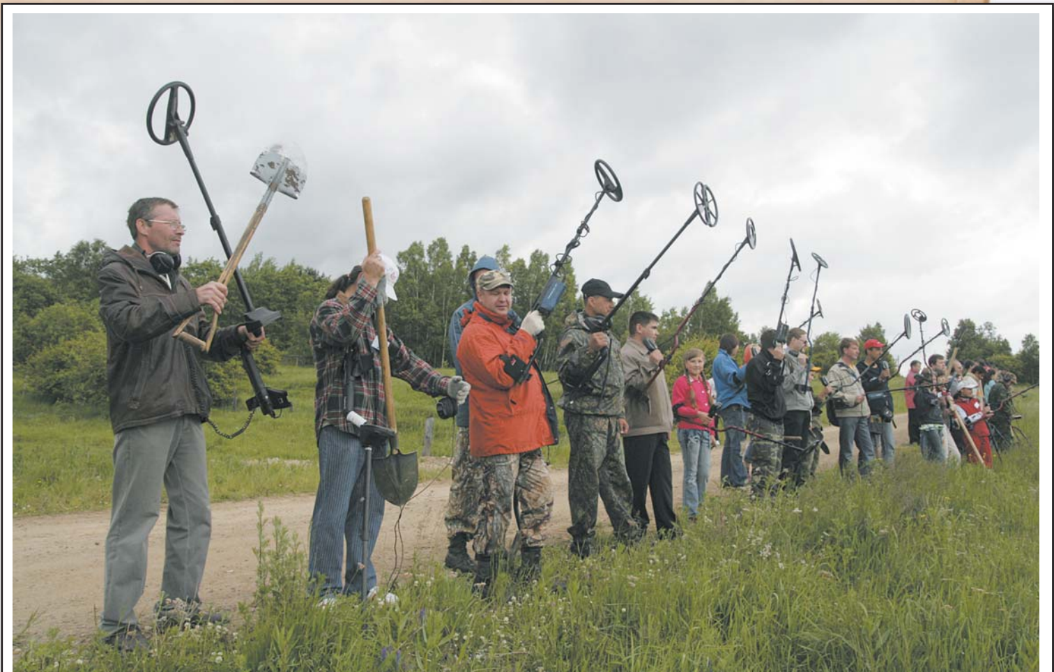
На открытии иркутского слета кладоискателей: в едином поисковом порыве