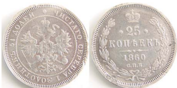
25 копеек, 1860, СПБ ФБ, серебро, VF, 12240.00