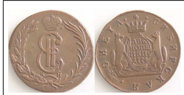
2 копейки Сибирь, 1774, КМ, медь, XF, 7730.00