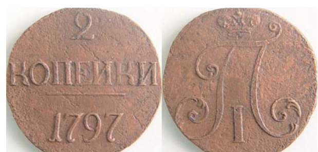
2 копейки, 1797, б/б, медь, VF, 5142.00