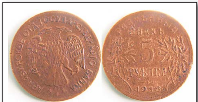
5 рублей Армавир, 1918, медь, VF, 5078.00