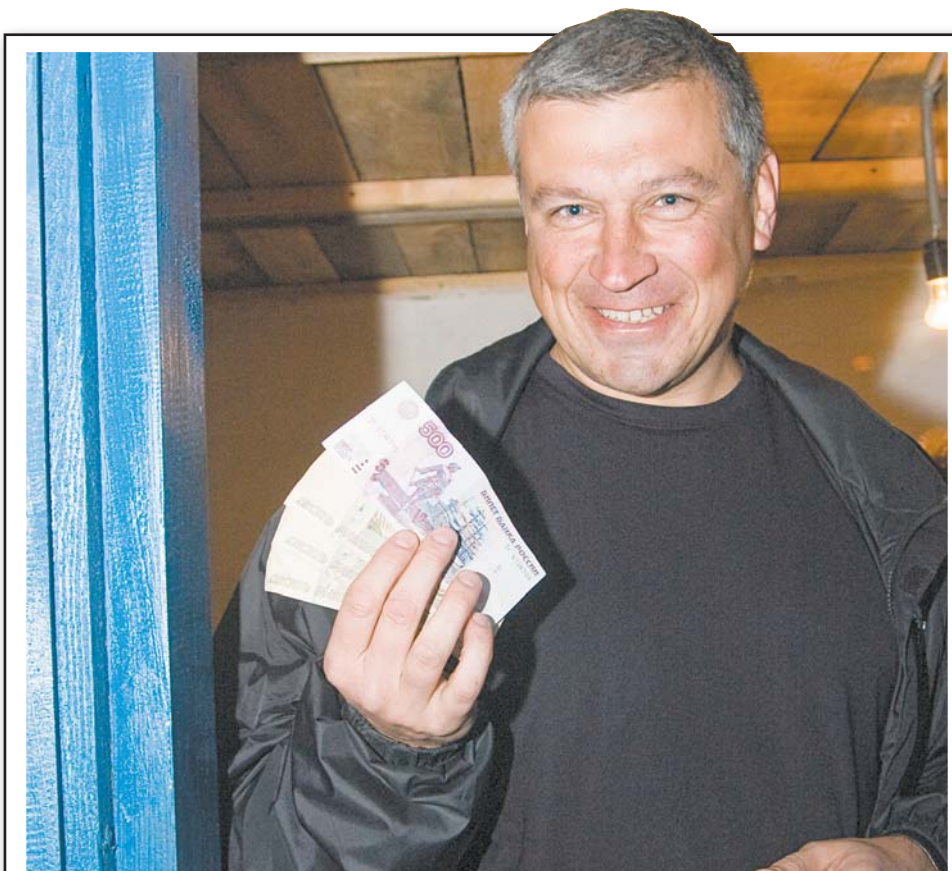
Вот они, денежки-то! Какалки «потянули» на 550 рублей