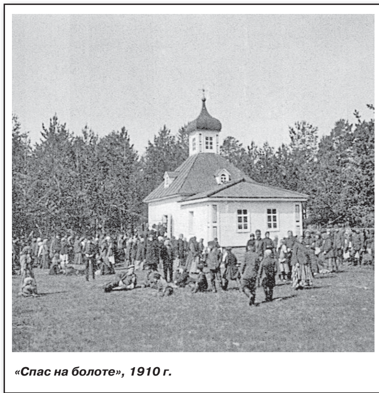
«Спас на болоте», 1910 г.

Старец с архипастырской грамотой поспешил прибыть в г. Орлов, предъявил оную грамоту духовенству и гражданам и нашел в них усердие и готовность спешествовать созидаанию обители. Граждане с общего согласия указали старцу приличное для построения монастыря место близ реки Вятки... Казалось, при недостатке средств нельзя было ожидать быстрого успеха, но желание граждан скорее видеть при своем городе святую обитель и ближе к себе иметь чудотворный образ Спасителя, было так велико, что, едва