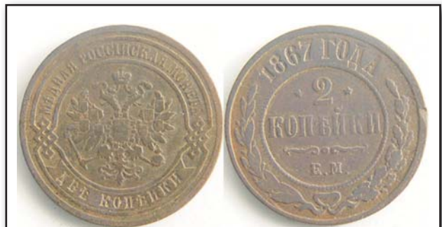
2 копейки, 1867, ЕМ, медь, VF, 5840.00