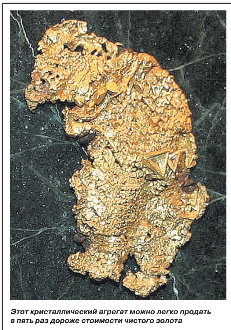
Этот кристаллический агрегат можно легко продать в пять раз дороже стоимости чистого золота

Имеется обширный рынок для коллекционеров красивых золотых самородков. Для продажи им золота вам необходимо иметь что-то особенное, представляющее интерес для них, а не просто золотой песок или мелкие хлопья. Обычно это самородки как минимум среднего размера или некоторые