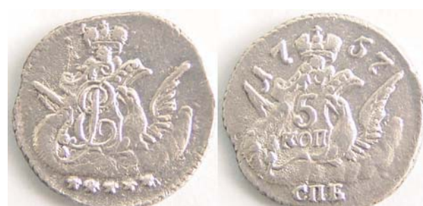
5 копеек «Орел в облаках», 1757, серебро, XF, 4544.00