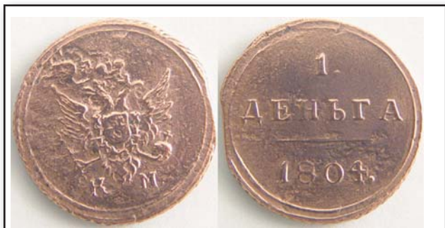
Денга Кольцевик, 1804, КМ, медь, VF, 15300.00