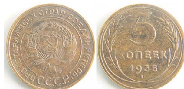
5 копеек СССР, 1935, бронза, XF, 4251.00