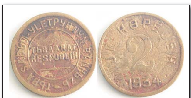
2 копейки Тува, 1934, бронза, VF, 5103.00