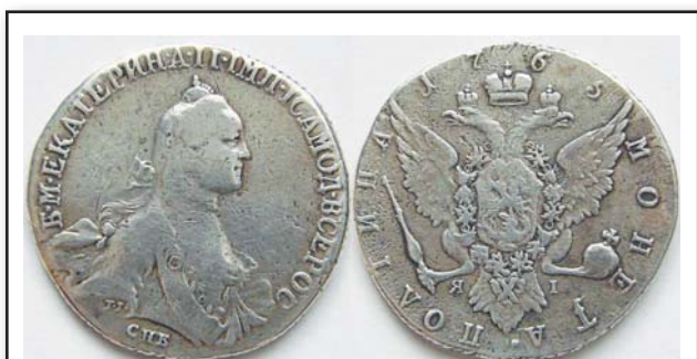
Полтина, 1765, СПБ Я, серебро, VF, 24898.00