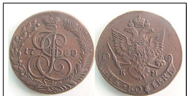
5 копеек, 1788, КМ, медь, XF, 6015.00