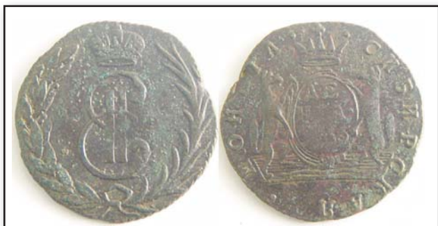
Денга «Сибирь», 1766, б/б, медь, VF, 21000.00