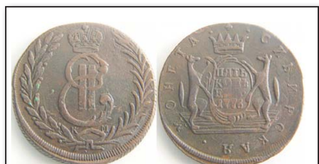
5 копеек «Сибирь», 1776, КМ, медь, XF, 4150.00