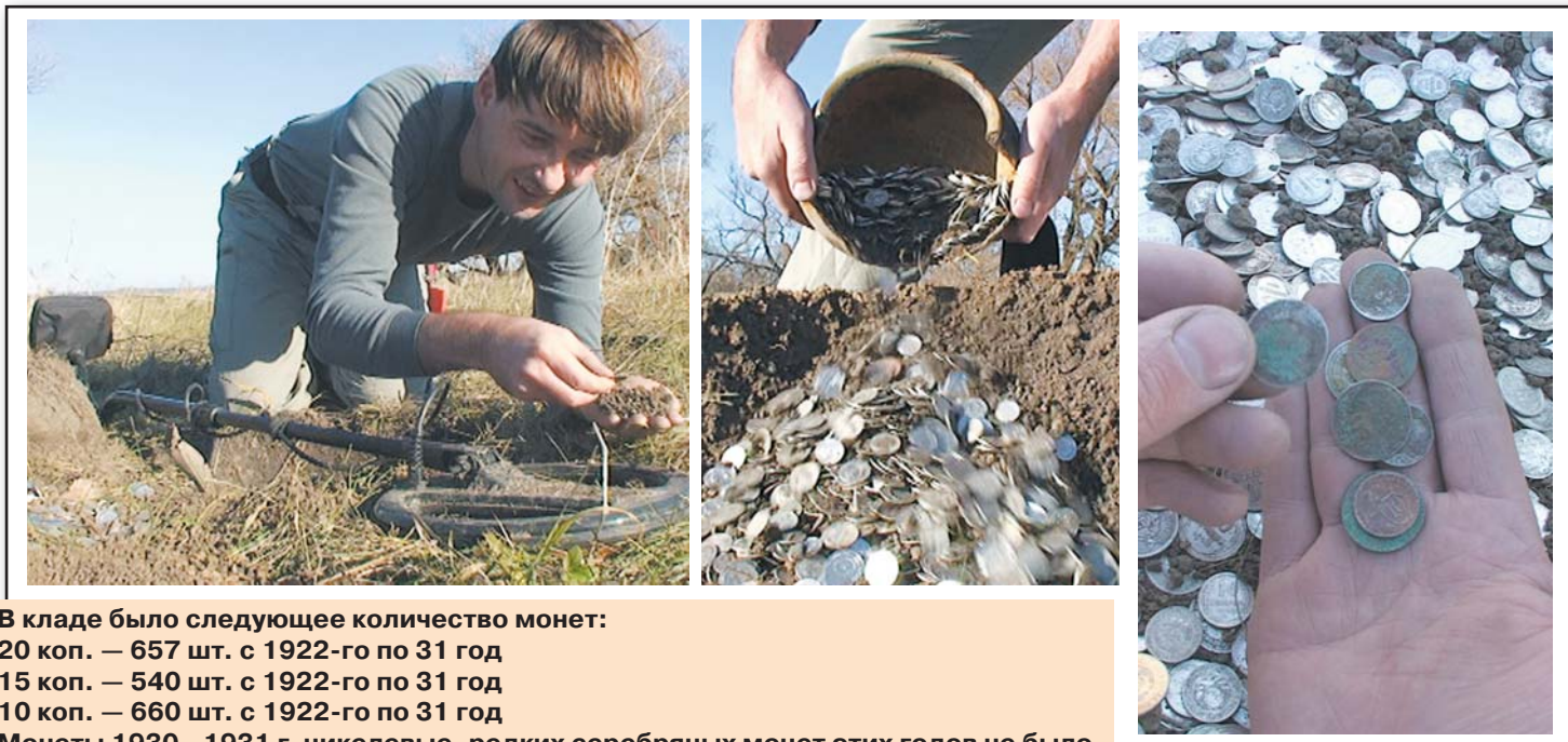
В кладе было следующее количество монет:

Обсуждение находки на форуме кладоискателей: forum.kladoiskatel.ru