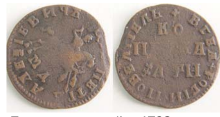
Петровская копейка 1708 года МД с соосностью около 45 градусов. Продана на аукционе VIP-115 за 1235 рублей

монет получаются не строго параллельными друг другу, а сдвинутыми на какой-то угол — от практически незаметного до 180 градусов.