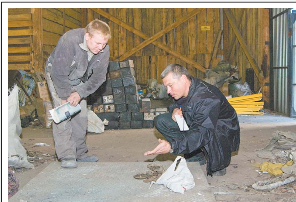
«Откуда это у вас, ребята?» — «Да так, из земли выкопали»