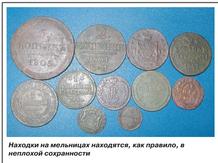
Находки на мельницах находят, как правило, в неплохой сохранности

Прибыв на место первой мельницы, я внимательно изучил особенности местности. Ничего явно бросающегося в глаза не попало. Следов и остатков построек не присутствовало. Единственное, что осталось, — это обводной ров протяженностью 157 метров,