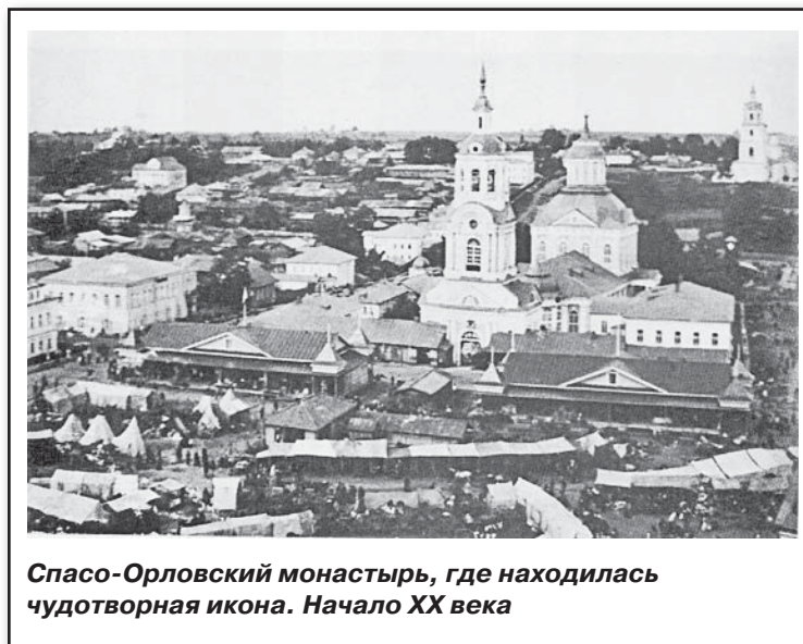
Спасо-Орловский монастырь, где находилась чудотворная икона. Начало XX века

В ней иконостас старинный, без царских врат резбленный и по местам вызолоченный на гульфарбу, о трех ярусах, поставлен в 1843 году, в длину 3 и в высоту 3 сажени, в нем всего двадцать шесть икон, на которых нет ни окладов, ни украшений.