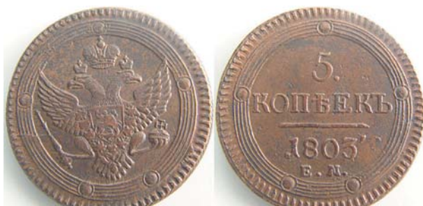
5 копеек Кольцевик, 1803, ЕМ, медь, XF, 4200.00