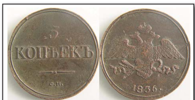
5 копеек, 1836, СМ, медь, XF, 5667.00