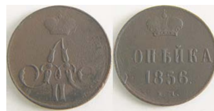
1 копейка 1856 года, непрочекан