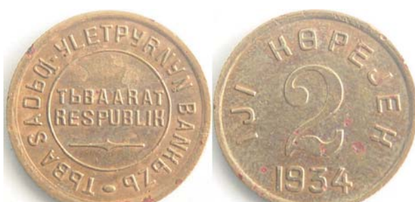
2 копейки «Тува», 1934, бронза, XF, 4872.00