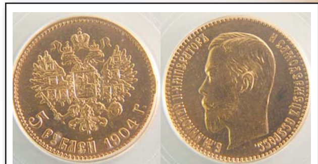
5 рублей, 1904, АР, золото, UNC, 8896.00