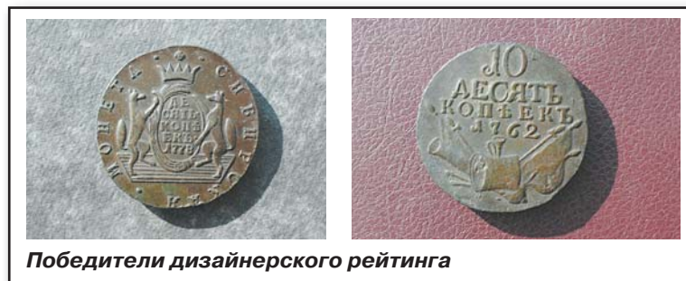
Победители дизайнерского рейтинга

Монета в 2 копейки 1764 года также видится мне очень