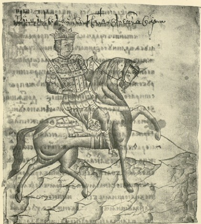
А., л. 2.—См. стр. 6, 191, приложение а.