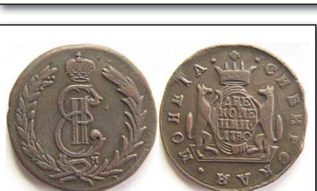
2 копейки Сибирь, 1780, КМ, медь, XF, 3570.00