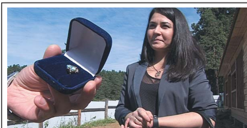
К счастью, осталась вторая сережка, по которой можно отстроить детектор