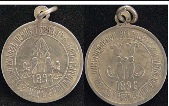
Жетон «В память Нижегородской всероссийской выставки», 1896, серебро 84, 4945.00