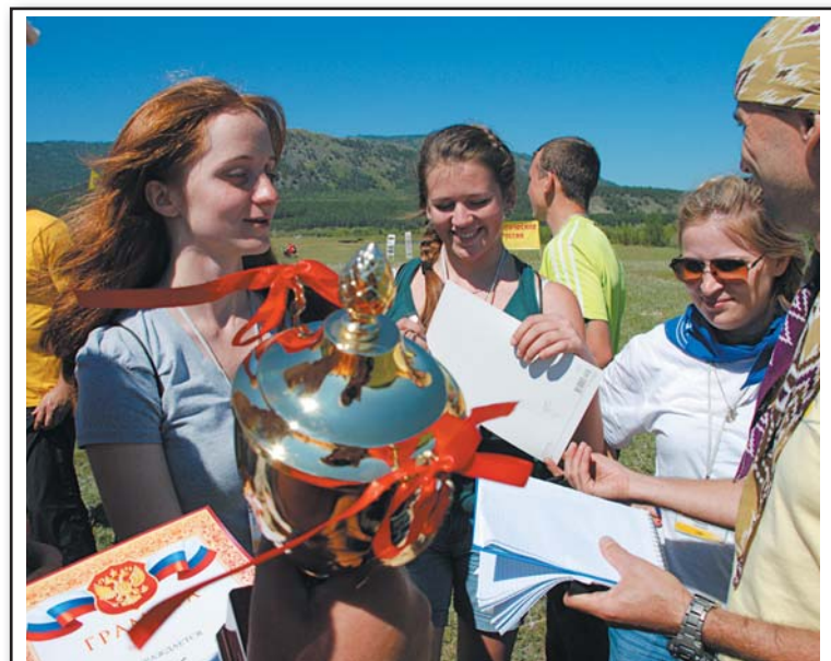
Команда победителей: четыре чешуйки, кубок и море позитива