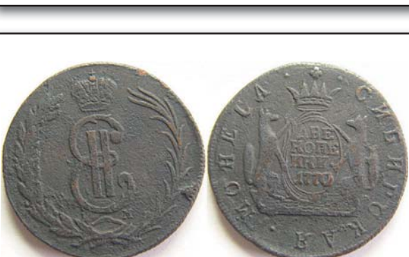
2 копейки Сибирь, 1770, КМ, медь, VF, 3024.00