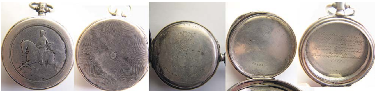
Корпус от часов «Павел Буре», 1911, серебро 84, 11 490.00