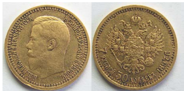
7 рублей 50 копеек, 1897, АГ, золото, XF-, 18 655.00