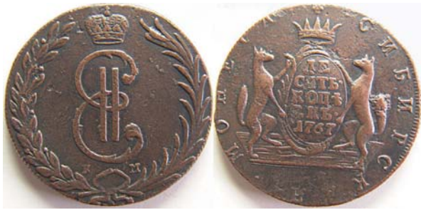
10 копеек Сибирь, 1767, КМ, медь, XF-, 10 117.00