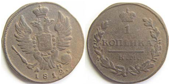
1 копейка, 1812, КМ АМ, медь, VF, 5000.00