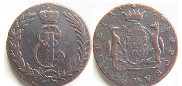
5 копеек Сибирь, 1767, КМ, медь, VF, 10 483.00