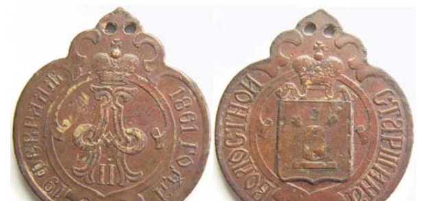
Бляха «Волостной старшина», 1861, латунь, 5296.00