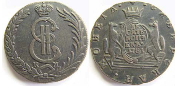
10 копеек Сибирь, 1781, КМ, медь, UNC, 18 799.00