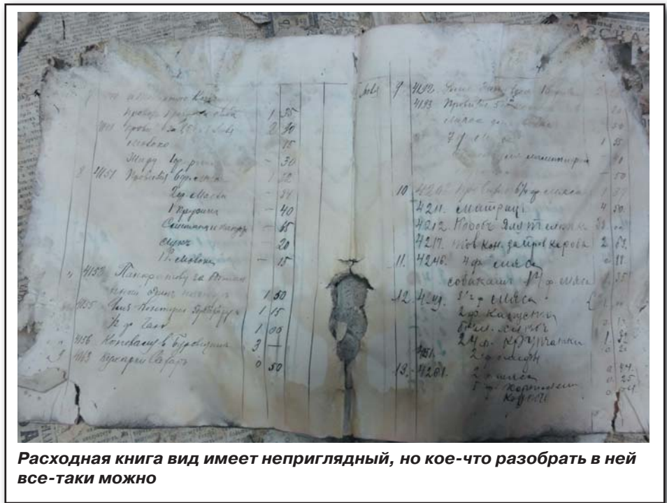
Расходная книга вид имеет неприглядный, но кое-что разобрать в ней все-таки можно

Дитриху за самовар, рулетку, книги — 24,40