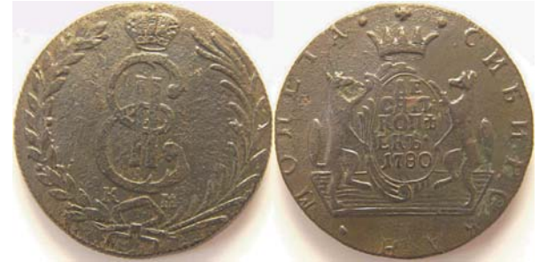
10 копеек Сибирь, 1780, КМ, медь, VF, 4859.00