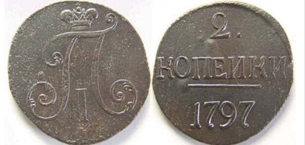
2 копейки, 1797, б/б, медь, VF+, 9377.00