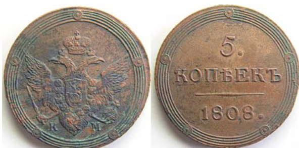
5 копеек Кольцевик, 1808, КМ, медь, XF, 12 185.00