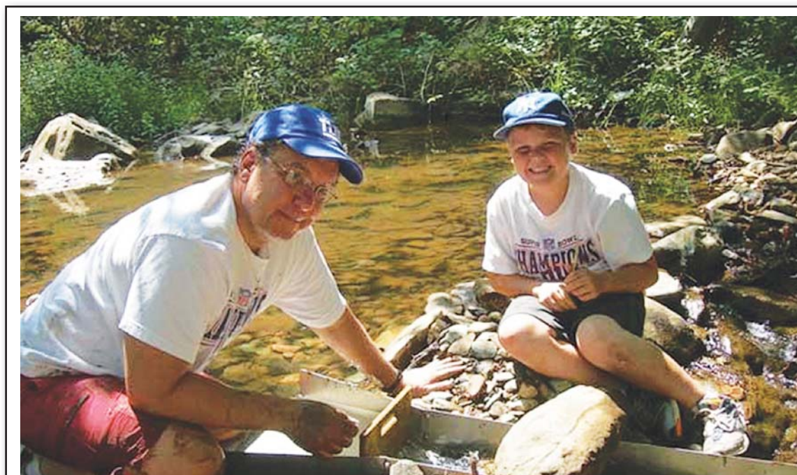
Поиск золота в США является одним из видов семейного отдыха. Сотни американцев, взяв с собой детей, уезжают на выходные дни на золотоносные реки в надежде найти свой самородок. Если не находят — сильно не расстраиваются: главное — хорошо отдохнули.