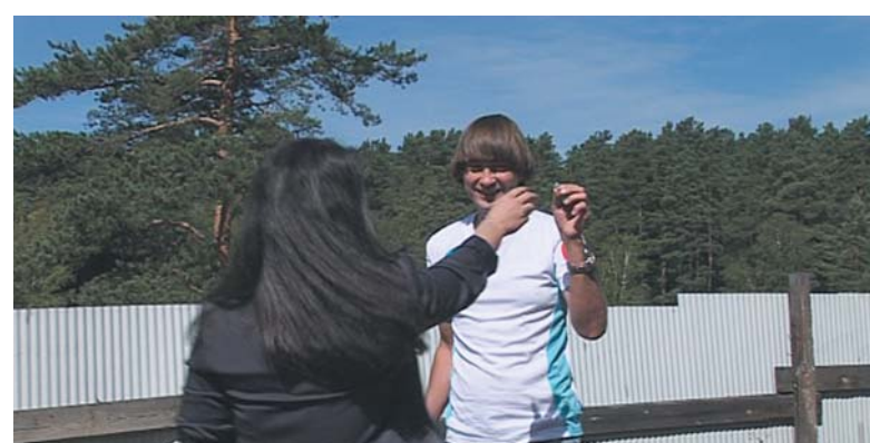
Вот она — цель!