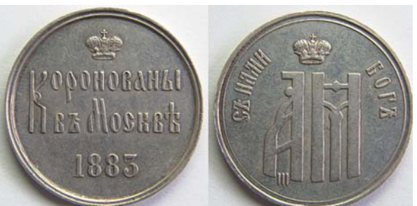
Жетон коронационный Александр III, 1883, серебро, 5000.00