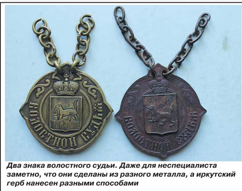
Два знака волостного судьи. Даже для неспециалиста заметно, что они сделаны из разного металла, а иркутский герб нанесен разными способами