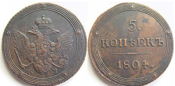
5 копеек Кольцевик, 1804, КМ, медь, XF+, 9809.00