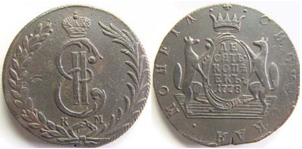
10 копеек Сибирь, 1778, КМ, медь, XF-, 6000.00