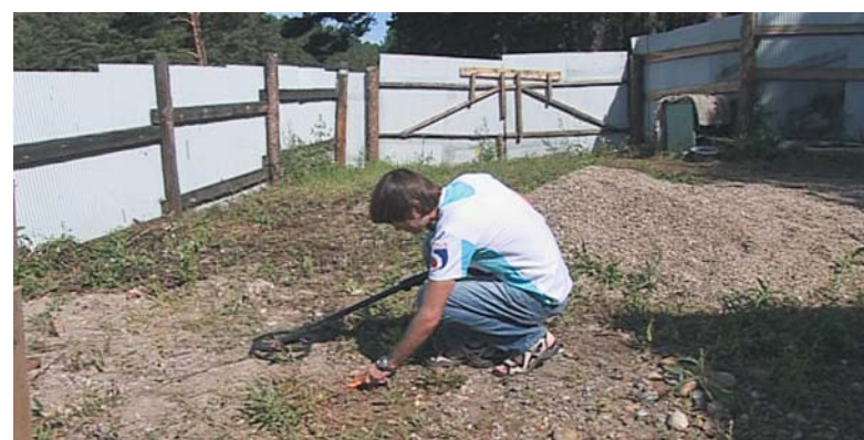
Первая цель оказывается пробкой, странным образом прикинувшейся золотом