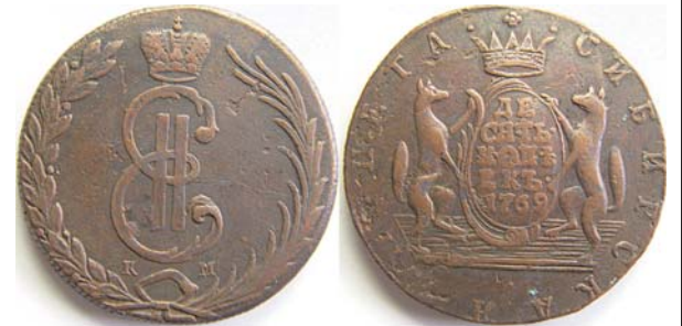
10 копеек Сибирь, 1769, КМ, медь, XF-, 8213.00