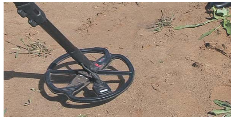
Почва песчаная, что для поисков, в принципе, неплохо. Ситуация осложняется наличием мусора.