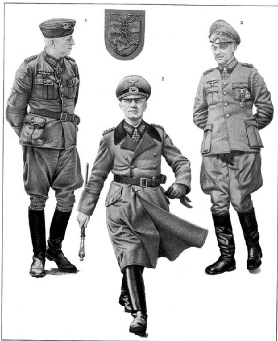
А1. Генерал-фельдмаршал Эрих фон Манштейн, Севастополь, июль 1942 г.

Командовавший в период штурма Севастополя группой армий «Юг» Генерал-фельдмаршал Эрих фон Манштейн одет в полевую форму с генеральским мундиром образца 1938 г. «нового стиля». На пилотке укреплен золоченая генеральская кокарда в виде орла со свастикой, кант пилотки и шеврон - золотые. Мундир полностью полевого серого цвета, без зеленого воротника, пошит из тонкой материи. Мундир дополнен бриджами серого цвета без генеральских лампас и офицерскими сапогами. Золоченый нагрудный орел, яркие петлицы и погоны являются непременным атрибутом генеральской формы. Погоны дополнены серебристыми фельдмаршальскими эмблемами. Рыцарский крест Манштейн получил 19 июля 1940 г., когда командовал XXXVIII корпусом во Франции. На мундире закреплена ленточка Железного креста 2-го класса, полученного Манштейном в Первую мировую войну. 25 июля 1942 г. был учрежден «Крымский щит» - нарукавный знак, которым награждались все солдаты и офицеры, сражавшиеся в Крыму с 21 сентября 1941 г. по 4 июля 1942 г. (на рисунке справа). На рукаве мундира Манштейна пришит вариант щита золотого цвета. На коричневом офицерском ремне, коим подпоясан генерал-фельдмаршал, висит кобура с пистолетом Вальтер ППК.