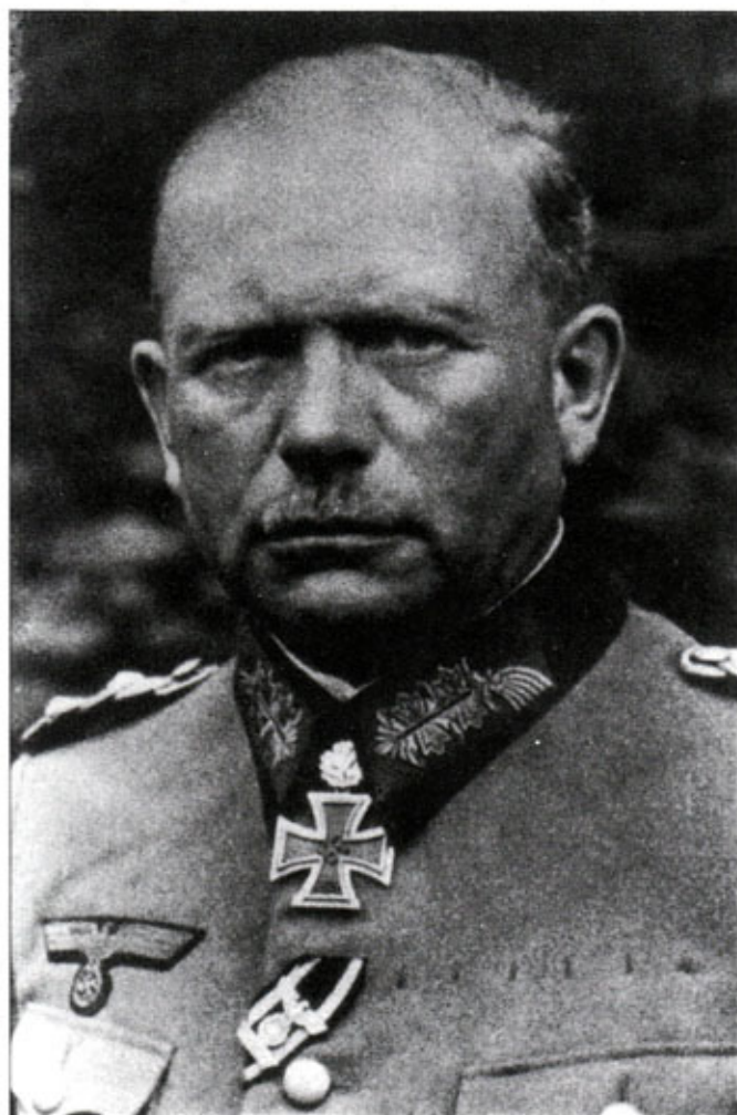
Гудериан с Рыцарскими крестом, дополненным дубовыми листьями. Хорошо видна полоска Железного креста 1914 г. с клипсой «1939». Снимок сделан, скорее всего, в жаркую погоду - генерал явно вспотел.

ной силой являются именно танки, а вовсе не пехота. Гудериан же только возможно отстаивал свои взгляды. Его поддержал начальник инспектората механизированных частей полковник Освальд Лютц. Именно Лютца, а не Гудериана при всех неоспоримых заслугах последнего, правильно будет считать отцом панцерваффе.