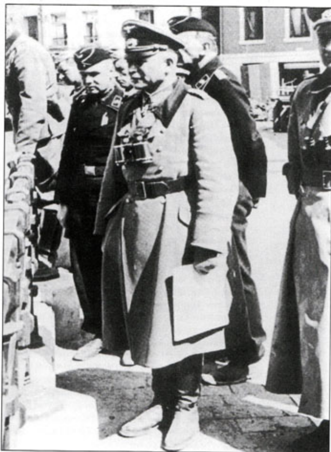
«Быстрый Гейнц» с офицерами-танкистами в момент своего величайшего триумфа - его XIX танковый корпус форсировал Маас и вышел к Булони в мае 1940 г. всего за неделю.

Когда о Роммеле говорят как о самом известном германском военачальнике Второй мировой войны следует делать одну оговорку «самым известным на Западе». В Советском Союзе люди рождались и умирали ни сном ни духом не услышав такой фамилии - Роммель. Зато о Гудериане слышали все, ну почти все. Самое интересное, что советская пропаганда, не жалеющая черной краски для германских генералов, к Гудериану относилась где-то даже с уважением. С исторической же точки зрения, заслуги Роммеля и заслуги Гудериана просто не сопоставимы. Первый формально командовал армией, а практически танковой дивизией, если не танковым полком. Второй создал танковые войска Германии и водил в бой самые настоящие танковые армии, причем как водил и в каких условиях! Роммель - продукт PR компании сначала доктора Геббельса, а затем западных германофилов. А кто же такой, Гейнц Гудериан, действительно самый знаменитый германский генерал Второй мировой войны? Кто вы, генерал Гудериан?