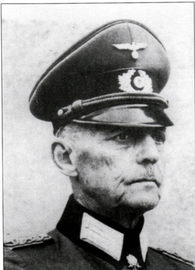
Поздний снимок фон Рунштедта сделан где-то в феврале - марте 1945 г. Виден Рыцарский крест с мечами и дубовыми листьями. Петлицы Рунштедт всегда носил, как у командира 18-го пехотного полка. Рунштедт всегда приходил в ярость, когда с его именем связывали наступления в Арденнах конца 1944 г. Он принимал участие в планирование этого наступления, будучи главным командующим германскими войсками на западном фронте, но - сугубо номинально. Наступление спланировал дилетант-стратег Гитлер.

Рунштедт с энтузиазмом поддержал план своего начальника штаба Манштейна по прорыву сквозь Арденны к Седану. Во многом благодаря Рунштедту план Манштейна получил одобрение фюрера. Под командованием Рунштедта было сосредоточено 44 дивизии и танковый корпус Гудериана. В мае 1940 г. Рунштедт блистательно претворил план в жизнь. Лишь знаменитый «стоп-приказ» фюрера позволили эвакуировать англичанам живую силу из Дюнкерка, лишив немцам полной и безоговорочной победы.