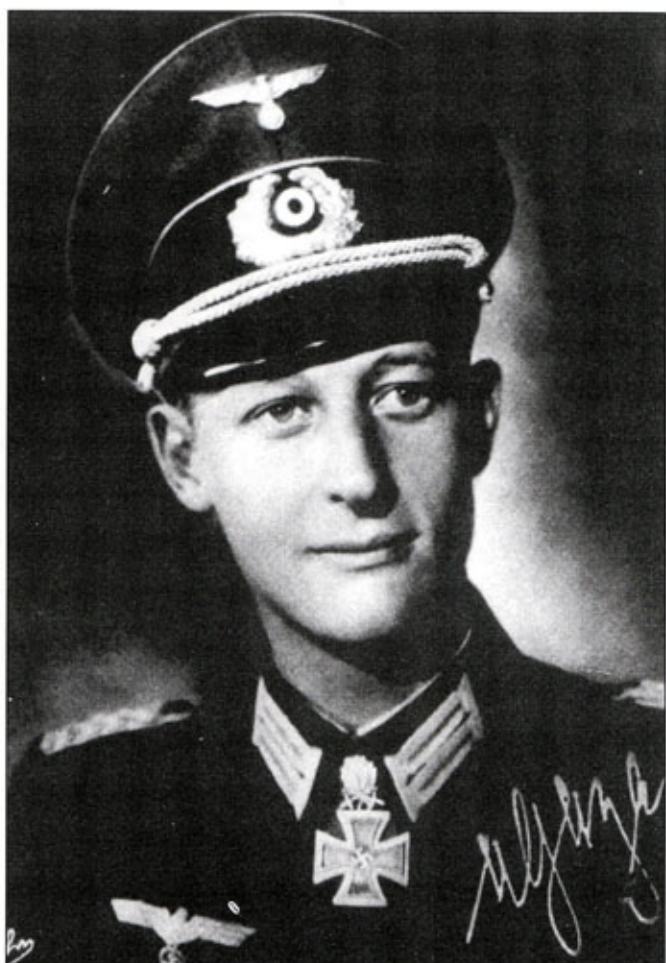
Командир панцергренадерского батальона майор Вальдемар фон Газен в парадно-выходной форме одежды с рыцарским крестом, снабженным дубовыми листьями и мечами.

Оппельн-Брониковски атаковал союзников в первый день их вторжения в Нормандию, 6 июня 1944 г. Из-за господства в воздухе авиации союзников и усложненной системы командования, немцы не смогли вовремя перебросить в место высадки десанта резервы. На пути к месту высадки десанта англичан 22-я панцердивизия подверглась многочисленным атакам истребителей-бомбардировщиков