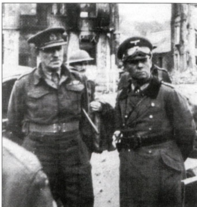
Генерал-майор Роммель в Сент-Валери, Франция, берег Ла-Манша, июнь 1940 г. Слева - генерал Виктор Фортуне, командир британской 51-й дивизии, которая была окружена 7-й танцдивизией Роммеля.

Африке продолжалась и немцы пока ее выигрывали. 23 июня пала Мерса-Матрух, однако в конце августа англичане остановили продвижение Роммеля у Элам-эль-Хальфа, на самой египетской границе. В немалой степени тому способствовал новый командующий 8-й армии генерал Бернард Монтгомери. Монтгомери основательно укрепил линию обороны у Эль-Аламейна и стал наращивать численность своих войск, пока обороняющиеся не стали превосходить наступающих итало-германцев вдвое. Монтгомери атаковал 23 октября 1942 г. В это время Роммель находился в Германии, а его заместитель генерал Георг Штومه погиб в бою на следующий день, 24 октября. Немцы стали отступать. Монтгомери нес тяжелейшие потери до тех пор, пока полностью не потеряли боеспособность итальянские дивизии, а немцы не лишились почти всей своей бронетехники. К 3 ноября Роммель имел в своем распоряжении всего 24 боеспособных танка. Гитлер официально разрешил отступление.