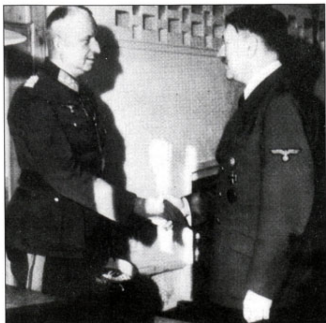
Манштейн на совещании у Гитлера, март 1943 г. Отношения Манштейна с фюрером были очень непростыми - он часто игнорировал личные приказы Гитлера, за что и был снят с должности в марте 1944 г.

В начале 1941 г. Манштейн командовал LVI танковым корпусом, который в начальный период операции «Барбаросса» действовал на северном фланге советско-германского фронта. За четыре