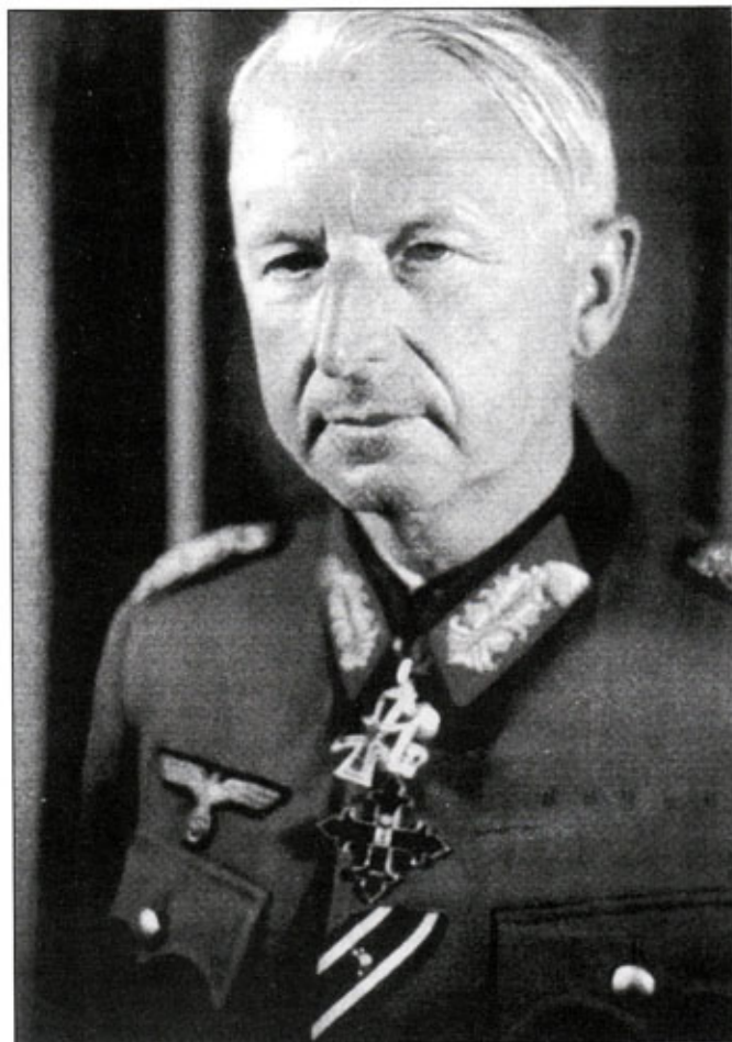
Официальный фотопортрет генерал-фельдмаршала Эриха фон Манштейна. Ниже Рыцарского креста висит румынский орден Михая Храброго. В южной России Манштейн командовал крупной группировкой румынских войск. Еще ниже - ленточка полученного в Первую мировую войну Железного креста 2-го класса.

жил на различных штабных должностях. В новом рейхсвере капитан Манштейн продолжил службу в штабе генерала фон Лоссберга, в 1927 г. получил майора. В 1932 г. Манштейн стал подполковником и в течение краткого промежутка времени командовал егерским батальоном. Вскоре после прихода в 1933 г. к власти нацистов Манштейн получил воинское звание полковник и был назначен начальником оперативного отдела Генерального штаба вермахта.