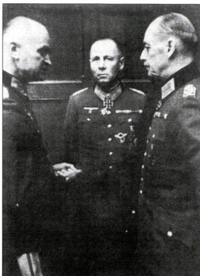
Снимок 1944 г. Роммель (в центре) на совещании у фельдмаршала Рунштедта (справа). Фото сделано незадолго до вторжения союзников в Нормандию. Интерес представляют «крылья» люфтваффе с брильянтами - награда Роммелю от Гитлера.

После командования рядом вспомогательных группировок, Роммель в ноябре 1943 г. был назначен командующим группой армий «В» во Франции. Фельдмаршал развернул бурную деятельность по строительству Атлантического вала и повсеместного укрепления обороны на случай неминуемого вторжения союзников в Западную Европу. В части непосредственного управления войсками у Роммеля были связаны руки многочисленными ограничениями, наложенными Берлином. Многие рекомендации Роммеля не выполнялись. На момент высадки союзников в Нормандии 6 июня 1944 г. Роммель находился в краткосрочном отпуске в Германии. Сложно сказать каким образом развивались бы события в день «Д» будь Роммель на месте и имел он возможность самостоятельно распоряжаться бронетанковыми резервами. Роммеля обвинили в попытке веде-