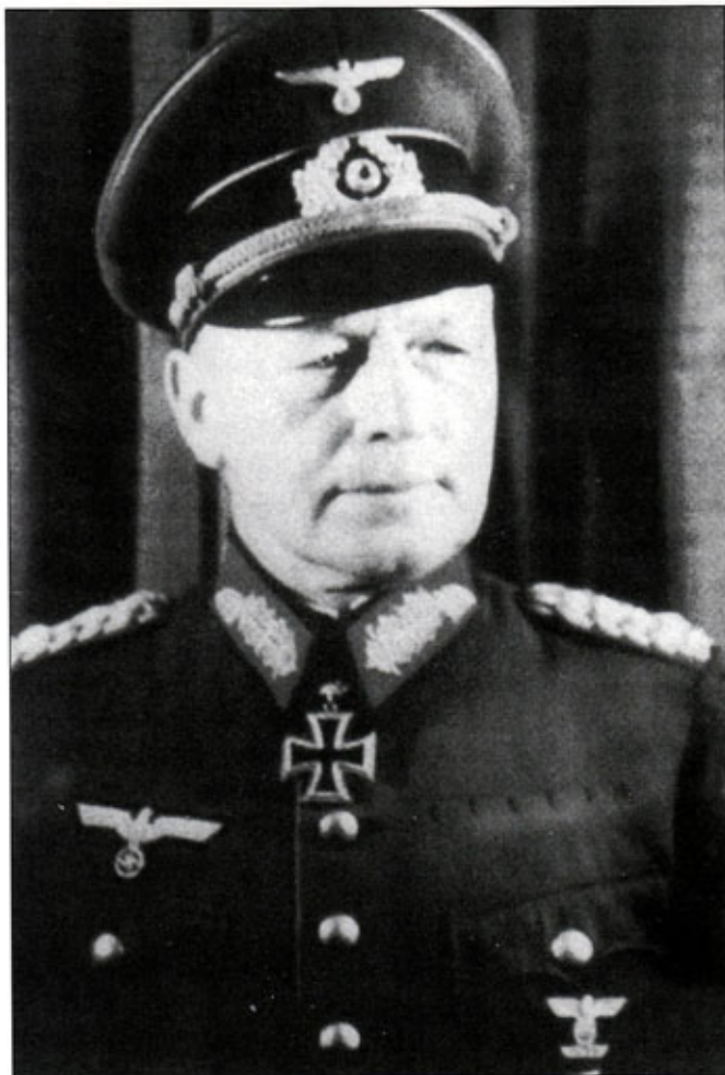
Генерал-полковник Эвальд фон Клейст, официальный фотопортрет перед вручением фельдмаршальского жезла. Удивительно, что для такого снимка Клейст ограничился минимум своих наград: Железный крест 1914 г. с клипсой «1939». На мундире видны дырочки от орденских колодок.

битве при Танненберге. За годы войны он сменил немало должностей, заняв в 1917 г. пост начальника штаба эгалитарной Гвардейской кавалерийской дивизии. С 1922 г. по 1926 г. майор фон Клейст преподавал тактику в кавалерийском училище в Ганновере, вырос здесь до подполковника, а в декабре 1926 г. стал начальником училища. 1929 г. полковник фон Клейст встретил командиром 9-го инфантерийского полка в Потсдаме. В январе 1932 г. Клейсту присвоили воинское звание генерал-майор, направив в Бреслау командовать 2-й кавалерийской дивизии. 1 октября 1933 г. Клейст становится генерал-лейтенантом, 1 августа 1936 г. - генералом от кавалерии.