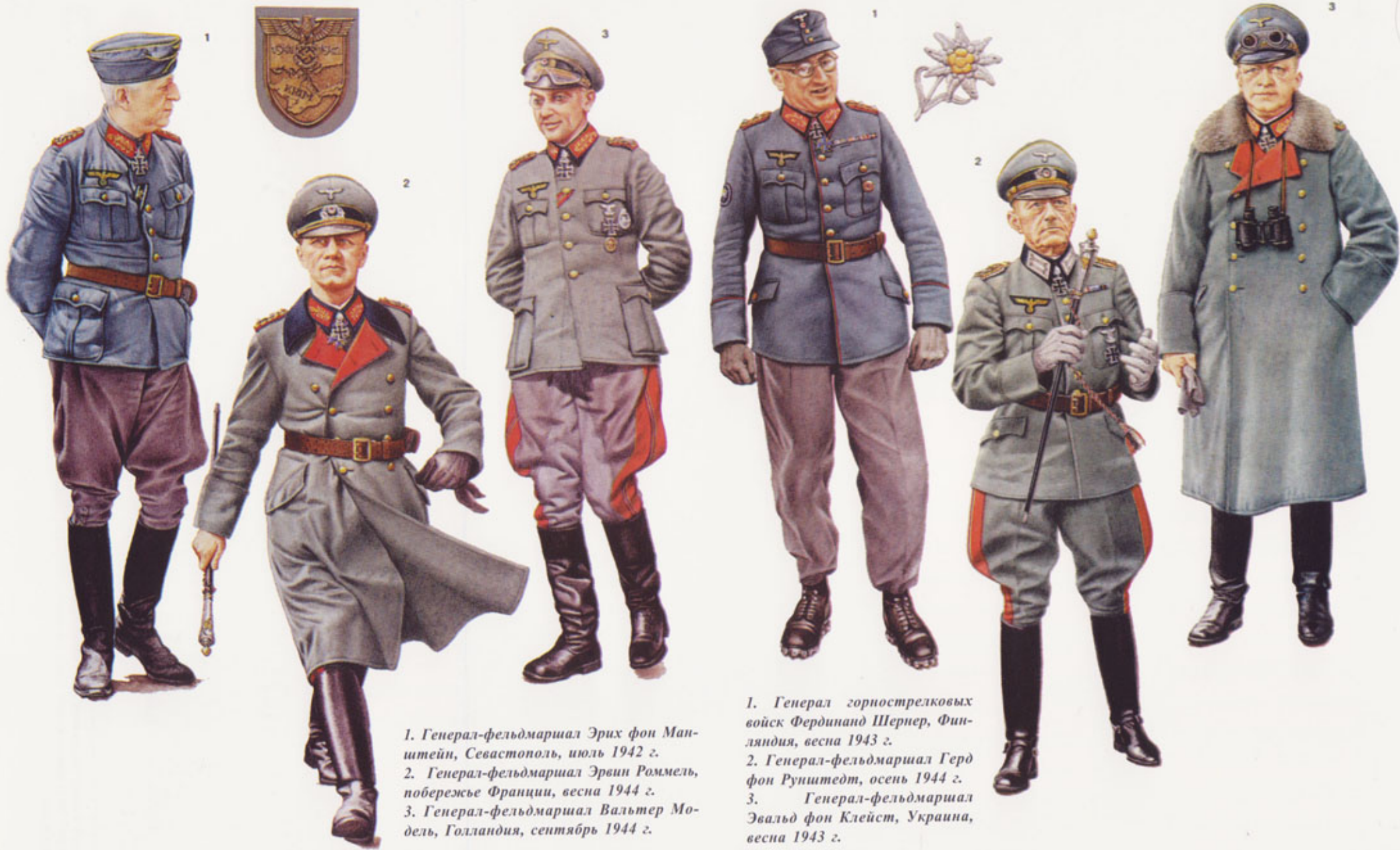
1. Генерал-фельдмаршал Эрих фон Манштейн, Севастополь, июль 1942 г. 2. Генерал-фельдмаршал Эрвин Роммель, побережье Франции, весна 1944 г. 3. Генерал-фельдмаршал Вальтер Модель, Голландия, сентябрь 1944 г.