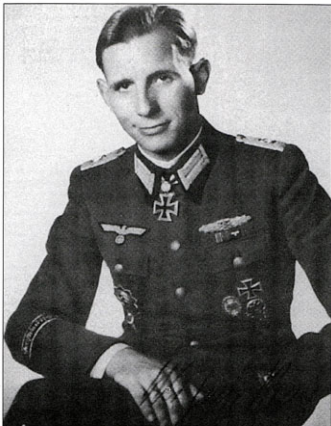
Подполковник Отто Ремер, снимок сделан вскоре после получения в ноябре 1942 г. дубовых листьев к своему Рыцарскому кресту. Личную храбрость проявил офицер механизированного батальона «Великая Германия» - тут без вопросов, но затем Ремер отличился при подавлении путча демократически настроенных офицеров-аристократов в июле 1944 г., чем и запомнился Истории.

кампании подполковник находился в строевых частях на фронте. В октябре 1941 г. он получил назначение в штаб 4-й панцердивизии, в январе 1942 г. на короткое время сменил полковника Эбербаха в должности командира 35-го танкового полка.