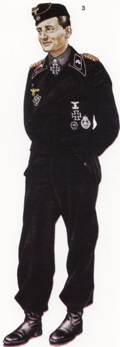
1. Генерал-майор доктор Франц Баке, Восточный фронт, апрель 1945 г. 2. Генерал-майор Хорст Нимак, Рур, март 1945 г. 3. Генерал-майор Герман фон Оппельн-Брониковски, Силезия, начало 1945 г.