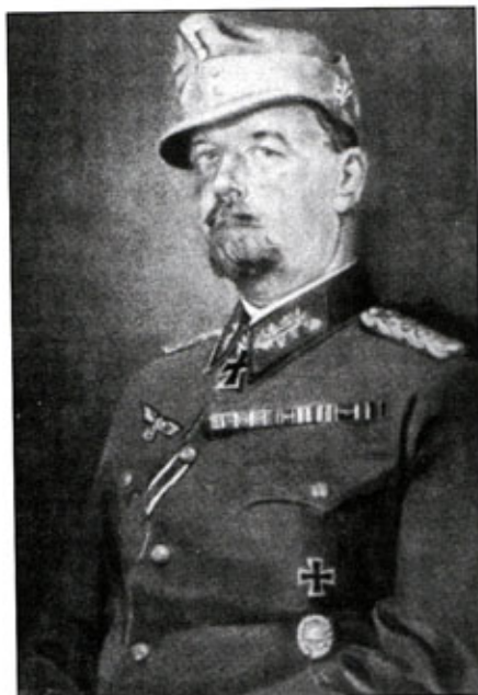
Официальный портрет австрийского горнострелкового генерала Юлиуса Рингеля, писанный маслом. На Крите Рингель блестяще командовал своими альпийскими стрелками, затем отличился в России и в Италии. Подчиненные любовно звали командира «папа Рингель».

Эбербах продолжал командовать 35-м танковым полком в период операции «Барбаросса», получил в этой должности 31 декабря 1941 г. дубовые листья на рыцарский крест. В январе 1942 г. Эбербах временно командовал 4-й танцдивизией, а в марте 1942 г. получил воинское звание генерал-майор и должность постоянного командира 4-й танцдивизии. Едва став командиром XXXXVII танкового корпуса, 1 декабря