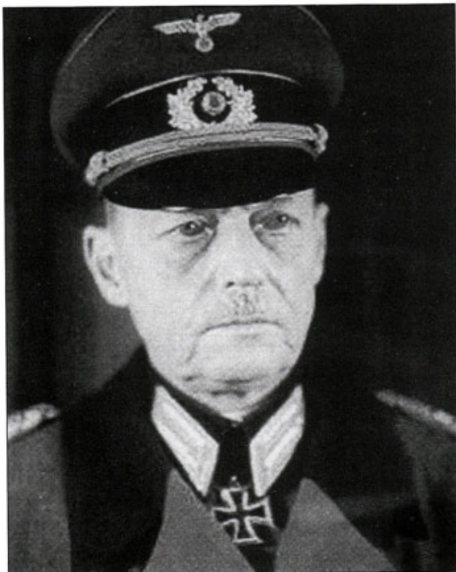
Официальный фотопортрет генерал-фельдмаршала фон Рунштедта. На фельдмаршале одета генеральская шинель с красными отворотами. Несмотря на свой ранг, Рунштедт всегда носил погоны и петлицы с белым пехотным цветом в память о командовании 18-м пехотным полком.

енного округа, штаб которого находился в Берлине. В октябре того же года ему было присвоено звание генерала пехоты с назначением командующим I группой армий, то есть теперь наш герой управлял доброй половиной германской армии.