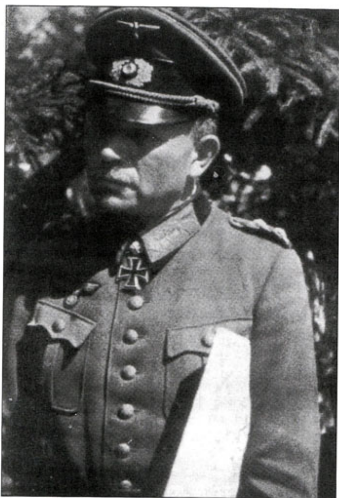
Генерал Гейнц Гудериан на полевом совещании. Генерал одет в старый мундир образца 1920 г. с восьмью пуговицами и красным кантом на борту.

ми германскими войсками в Лапландии. В июне 1942 г. ему присвоили звание генерал-полковника.