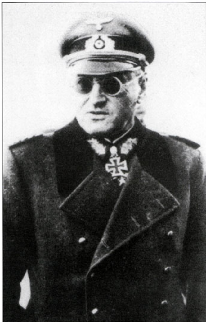
Шернер сфотографирован зимой где-то на Восточном фронте в полевой обстановке. Отлично видим Рыцарский крест с дубовыми листьями и мечами, значит снимок сделан после августа 1944 г. Темные очки предохраняют глаза от нестерпимого блеска снежного покрова на ярком солнце.

Несмотря на свое «горнострелковое» происхождение, Шернер в октябре 1943 г. стал командиром сражавшегося на Днепре XL танкового корпуса. Совсем скоро Шернер уже командовал временной группировкой из трех корпусов - «группой Шернера», известной так же как «Агмееабteilung Nikopol». Шернер экстремально удачно оборонял фронт, протяженностью 140 км, сдержав несколько мощных ударов Красной Армии. В январе - феврале 1944 г. позиции Шернера советские войска обошли с фланга, из-за чего пришлось отводить войска с Никопольского выступа на правый берег Днепра. За успешные действия в обороне 17 февраля 1944 г. Шернер был удостоен Дубовых листьев на Рыцарский крест. Тогда же Шернер стал лидером партийной организации корпуса - редкий случай среди германского генералитета: комиссар и командир в одном лице.