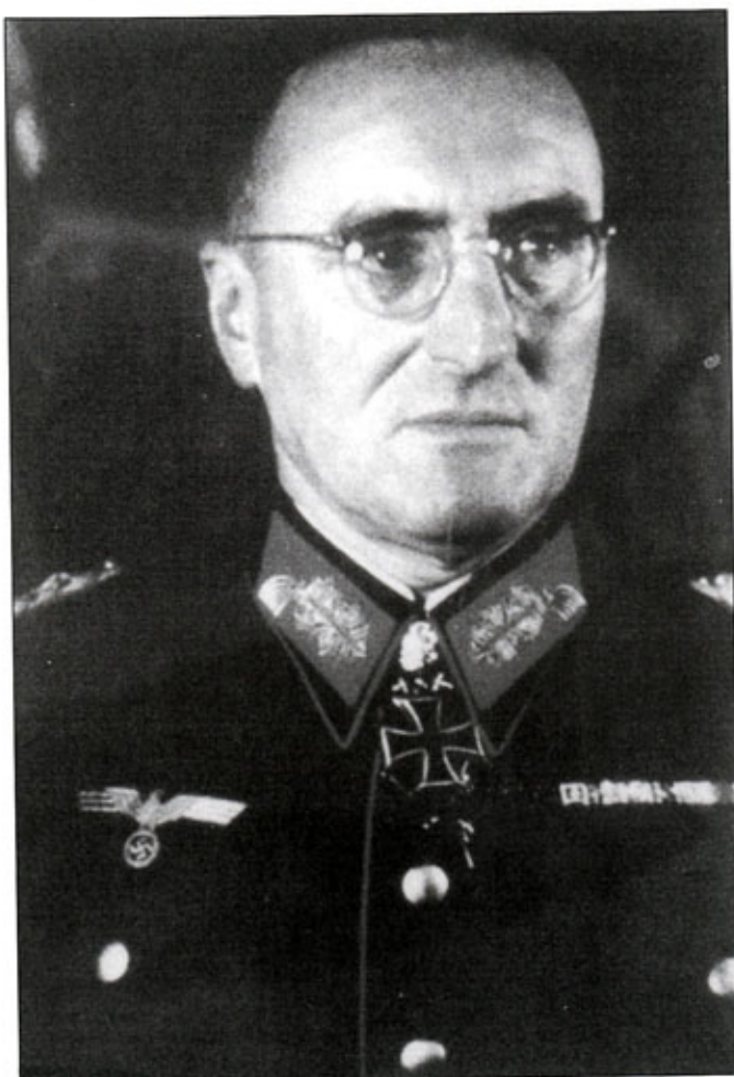
Генерал Фердинанд Шернер, типичный фотопортрет германского генерала. Шернер имел репутацию жесткого командира, но пользовался популярностью в войсках, особенно у фронтовиков. Шернер не любил тыловых крыс и не однажды «вычищал» тылы, отправляя излишки людей на передовую. Шернер также многократно не выполнял приказы, которые, по его мнению, вели к напрасным жертвам среди солдат.

Фердинанд Шернер родился в Мюнхене 12 июня 1892 г. в семье офицера полиции. В 1911 г. юный Шернер короткое время добровольно служил в Баварской армии, после чего решил получить общее образование, чтобы стать школьным учителем. С началом войны Шернер вернулся на военную службу в качестве лейтенанта резерва. На Западном фронте Шернер получил богатый боевой опыт,