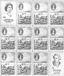
Илл. В. Малый лист почтовых марок островов Кука выпущена 1965 г. с изображениями вида на город и порт Петропавловск-Камчатский