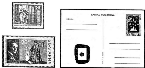
Илл. 17. а) Памятник В. И. Ленину в Берлине работы скульптора Н. В. Томского на марке ГДР; б) Ф. И. Шалапин в роли Бориса Годунова на марке Болгарии; в) почтовая маркачница Польши и II Международной выставке плакатов в Варшаве, 1963 г. (на вклепанной марке — планет и опере М. Мусоргского «Борис Годунов»)