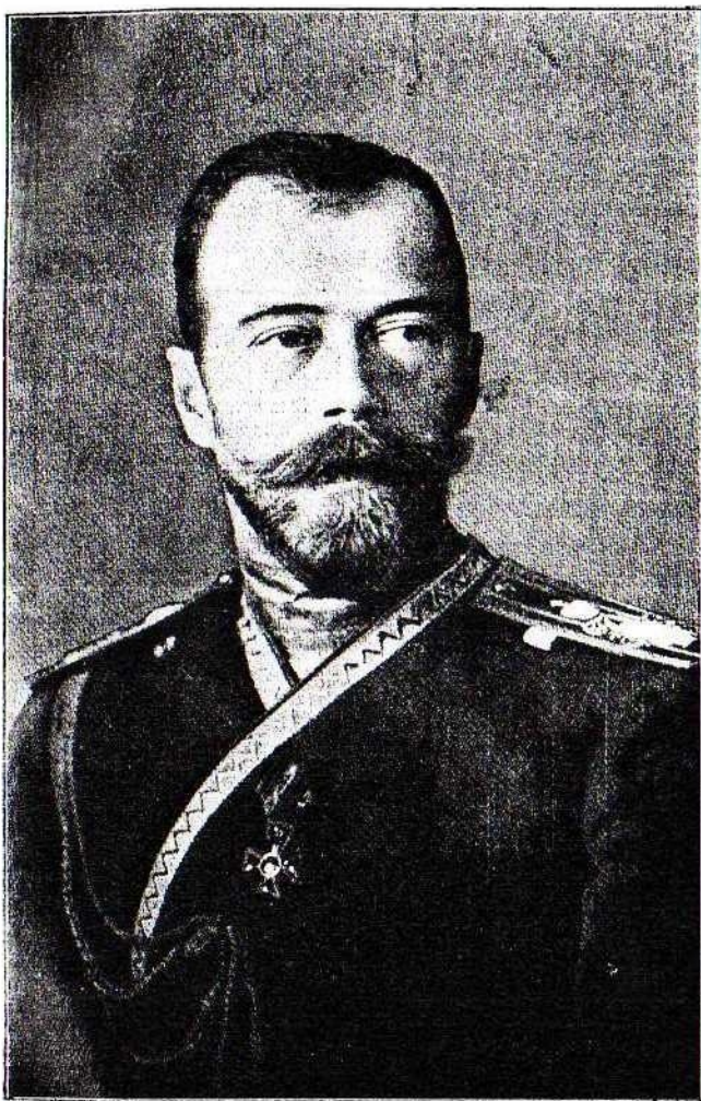
Его Императорское Величество Государь Императоръ Николай II.