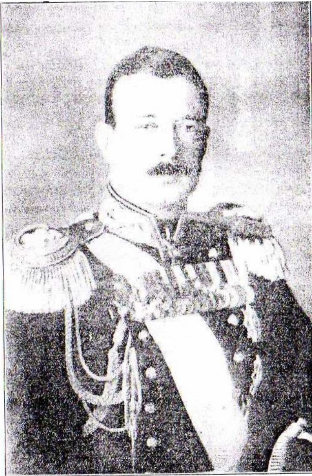
Глава Династiи Е. И. В. Кириллъ Владимiровичъ.