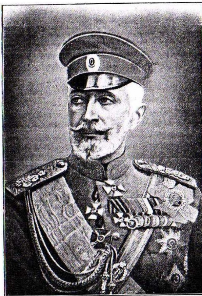
Е. И. В. Великій Князь Николай Николаевичъ.