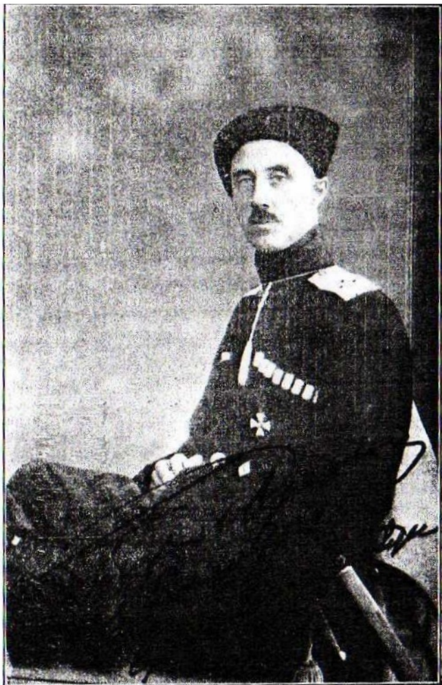
Генераль-лейтенантъ Петръ Н. Баронъ Врангелъ Бывшій офицеръ 1-го Кав. Полка.