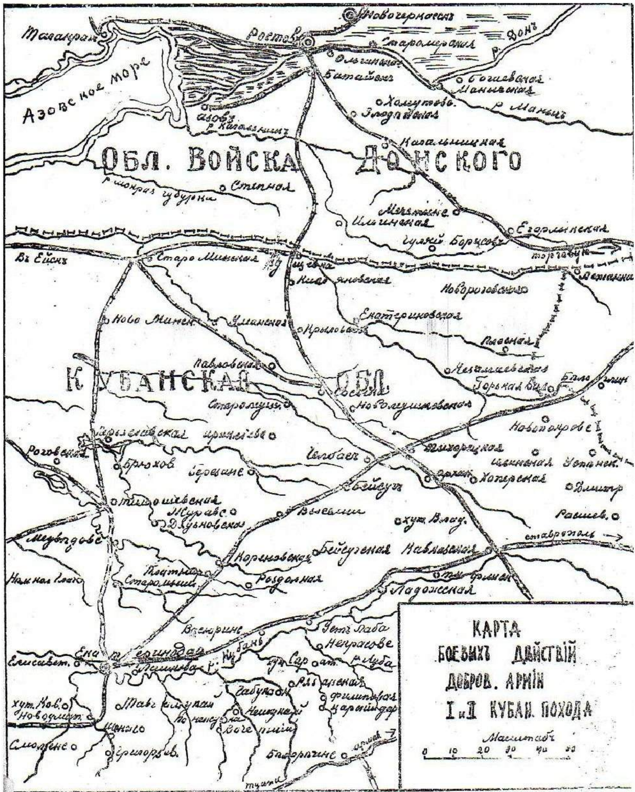
КАРТА БОЕВЫХ ДЕЙСТВИЙ ДОНСКОГО ВОЙСКА И КИУБАНСКОЙ ОБЛАСТИ