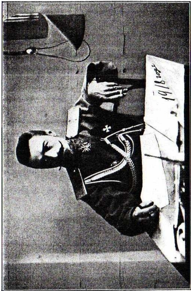
Генералъ-лейтенантъ Сергей Л. Марковъ

Бывшій офицеръ Л.-Гв. 2 артиллерійской бригады.