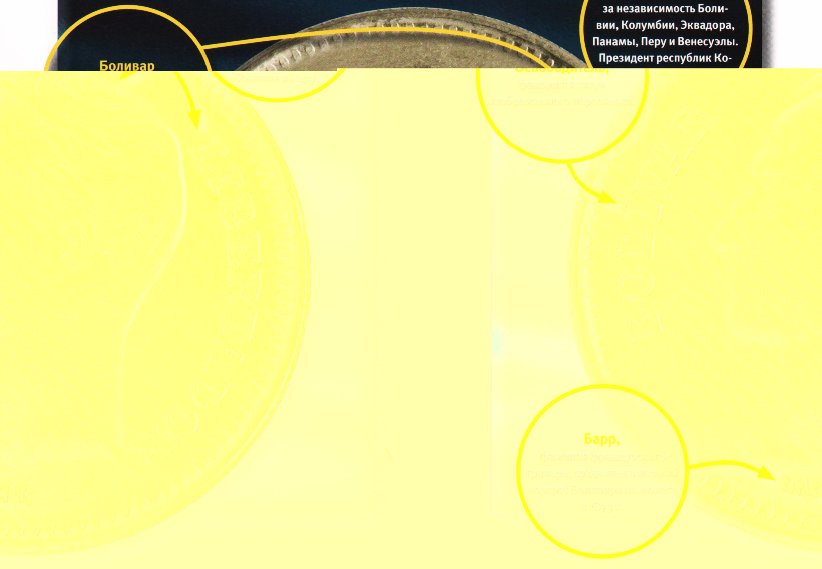
фамилия французского гравера, создавшего первый портрет Боливара на монете в 1873 г.