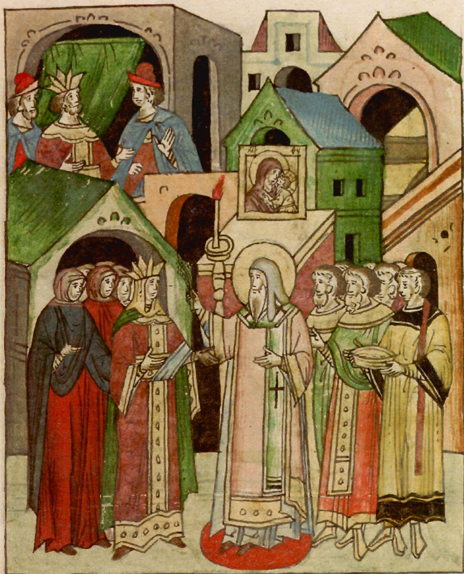
«Исцеление ханши Тайдулы». Миниатюра Повести о Алексии митрополите из Лицевого свода. Остермановский I, л.747об. Вторая половина XVI в. ОР. БАН. 31.7.30.