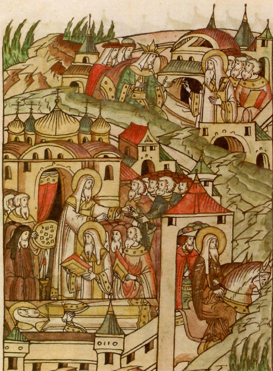
«Исцеление ханши Тайдулы». Миниатюра Повести из Лицевого свода, Остермановский I. Остермановский I, л.496. Вторая половина XVI в. ОР. БАН. 31.7.30.