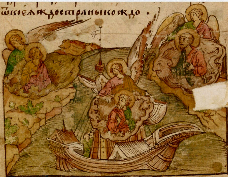
Егоровский сборник (РГБ, Егор. 1884), л. 101; двухбушпритный корабль, л. 240.