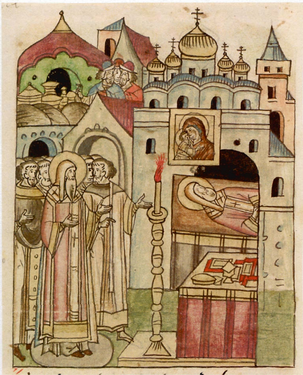
«Моление у гроба митрополита Петра в Успенском соборе перед поездкой в Орду». Миниатюра Повести о Алексии митрополите из Лицевого свода. Остермановский I, л.745об. Вторая половина XVI в. ОР. БАН. 31.7.30.