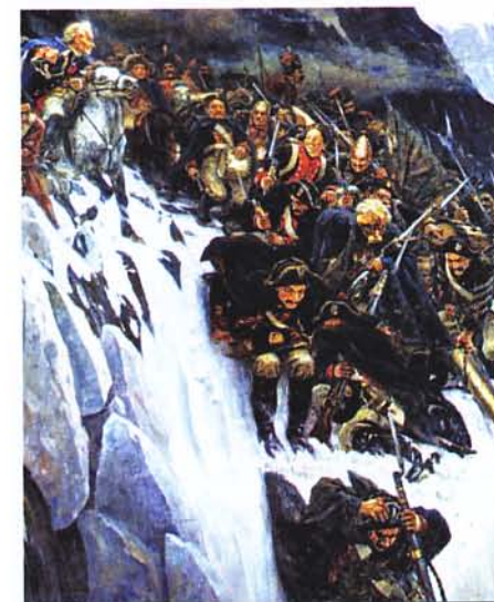
«Переход Суворова через Альпы» 1899 год. Холст, масло. Государственный Русский музей. Санкт-Петербург. Художник: Василий Суриков.

В сентябре 2007 года в Приднестровье был учрежден свой Орден Суворова. Кавалерами ордена являются Президент Южной Осетии Эдуард Кокойты и Президент Абхазии Сергей Багапш. В октябре 2008 года Орден Суворова второй степени был присужден городу Бендеры.