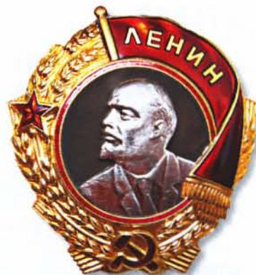
Орден Ленина. Вручался с 1932 по 1991 г. г.

Такие ордена вручались и во время Великой Отечественной войны – с 1943 года до распада СССР. За этот пе-