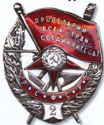
Орден Красное Знамя РСФСР с картушем

На этот момент главным негласным символом нового государства было знамя Красной Армии. В неразработанной еще системе советских символов, революционной красное знамя стало первым наградным предметом. Специальная комиссия для составления проекта индивидуальных наградных знаков предложила два варианта – орден Красное Знамя и орден Красная Гвоздика; вскоре первый вариант был принят окончательно.