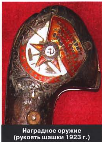
Наградное оружие (рукоять шашки 1923 г.)