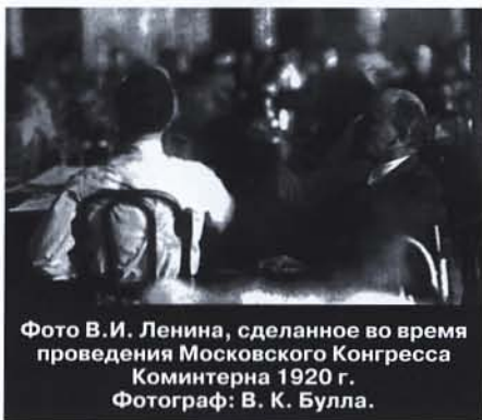
Фото В. И. Ленина, сделанное во время проведения Московского Конгресса Коминтерна 1920 г.

В композицию ордена образца 1930 года, кроме профиля Ленина входили треугольник – символ союза рабочих, крестьянства и интеллигенции, а также трактор – символ индустриализации.