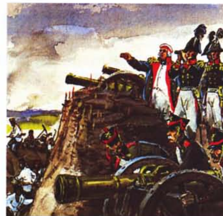
«Кутузов осматривает позицию при Бородине». Фрагмент акварели В. Шевченко. 1970-е гг.

Орден был сохранен в системе наград Российской Федерации Постановлением Верховного Совета Российской Федерации от 20 марта 1992 года N 2557. Однако он не имеет официального описания, награждение орденом в России не проводилось.