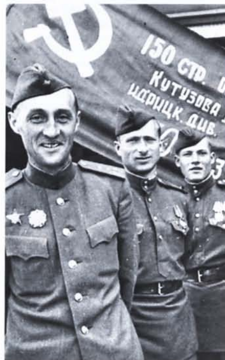
Бойцы со штурмовым флагом 150-й Ордена Кутузова II степени Идрицкой стрелковой дивизии, водруженным 1 мая 1945 года над зданием Рейхстага в Берлине.