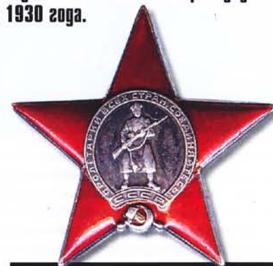
Орден Красной Звезды 1930-1936 г. г.

На оборотной стороне у Красной Звезды есть нарезной штифт — металлическая заклепка, с гайкой для крепления к одежде.