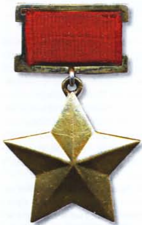
Медаль Золотая Звезда Героя - знак высшей степени отличия, звания Героя Советского Союза.

Медаль Золотая Звезда героя располагалась выше иных знаков отличия в наградном пантеоне. Главный наградной знак был учрежден в качестве дополнения к званию Герой Советского Союза, которое было установлено Постановлением ЦИК СССР от 16 апреля 1934 года.