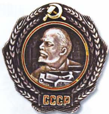
Орден Ленина. Ранний вариант. Вручался с 1930 по 1932 г.г.