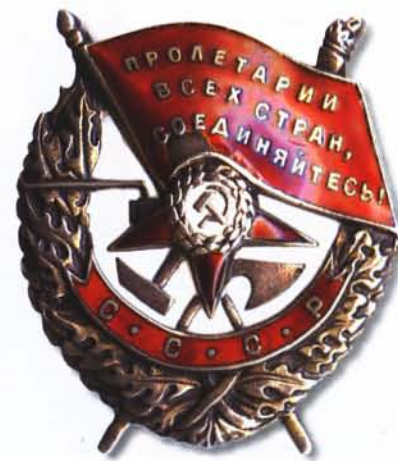
Орден Красное Знамя СССР

11 января 1932 года был принят первый статут ордена, уравнявшего в правах кавалеров орденов РСФСР и СССР. Орден стал называться орденом Красного Знамени.