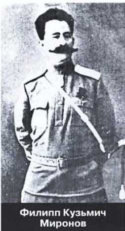
Филипп Кузьмич Миронов