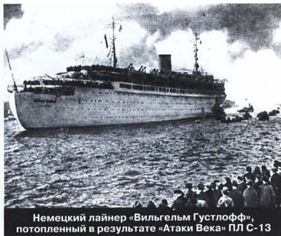
Немецкий лайнер «Вильгельм Густлофф», потопленный в результате «Атаки Века» ПЛ С-13

частей, подразделений и предприятий, а также 55 боевых кораблей (28 надводных кораблей и 27 подводных лодок).