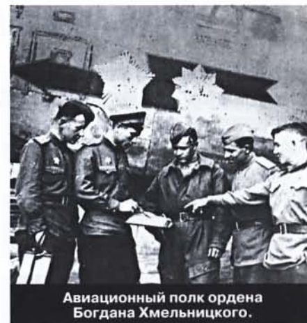
Авиационный полк ордена Богдана Хмельницкого.

3 мая 1995 года президент Украины Леонид Кучма учредил аналог советского ордена Богдана Хмельницкого в Украине.