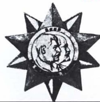
Ранний эскиз ордена Победы художника Неелова Н. С.

Все ордена, врученные советским военачальникам, а также Маршалу Польши, находятся в Центральном музее Вооруженных сил Российской Федерации.