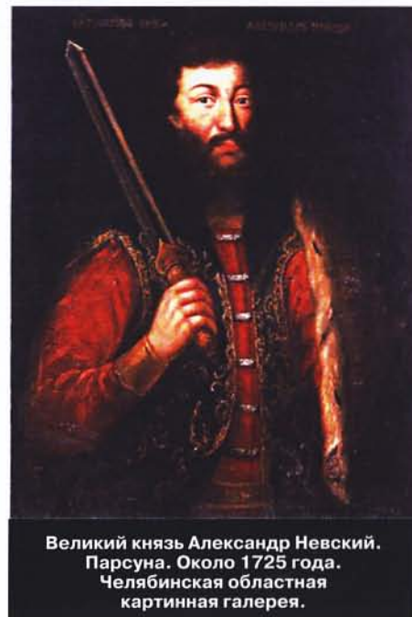
Великий князь Александр Невский. Парсуна. Около 1725 года. Челябинская областная картинная галерея.