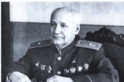
Авиаконструктор Андрей Николаевич Туполев