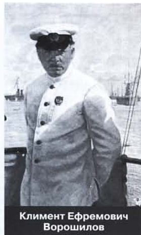
Климент Ефремович Ворошилов

ской, не дожидаясь официальных орден от Монетного двора. Орден этот был безномерным, а по настоянию бойцов из отряда для Якира был изготовлен и еще один из золота и платины.