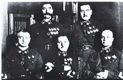
Первые пять маршалов СССР с орденами Красного Знамени. Слева направо: (в первом ряду) Михаил Николаевич Тухачевский, Климент Ефремович Ворошилов, Александр Ильич Егоров, (во втором ряду) Семен Михайлович Буденный, Василий Константинович Блюхер.

Носить орден предписывалось на левой стороне груди. Несмотря на то, что Красное Знамя СССР было учреждено в 1924 году, орден не производился до 1930 года, так как значительное количество республиканских орденов осталось на складах.