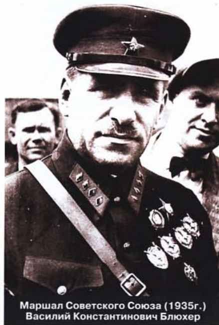
Маршал Советского Союза (1935г.) Василий Константинович Блюхер

Орденом была награждена газета «Красная звезда» (что засвидетельствовало Постановление ЦИК СССР от 27 декабря 1933 года) – за успехи в деле обеспечения боевой и политической подготовки Советской Армии.