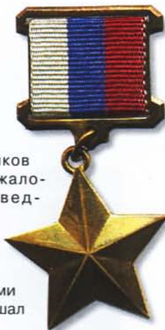
Медаль Золотая Звезда Героя РФ

Звание Героя было восстановлено Законом «Об установлении звания Герой Российской Федерации и учреждении знака особого отличия – Медали Золотая Звезда» от 20 марта 1992 года и введено в действие в тот же день.