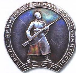
Медальон ордена Красной Звезды 1936-1980 г. г.