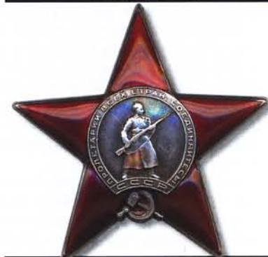
Орден Красной Звезды (1936-1980) с измененным медальоном