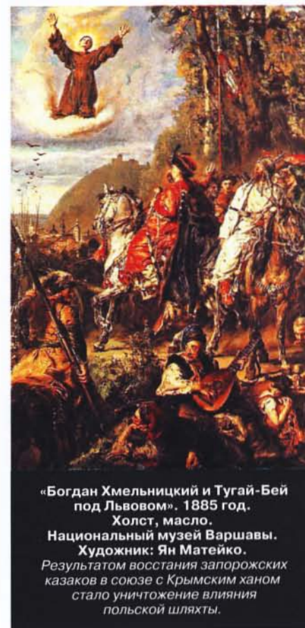
«Богдан Хмельницкий и Тугай-Бей под Львовом». 1885 год.