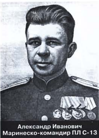
Александр Иванович Маринеско-командир ПЛ С-13